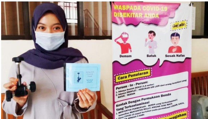
Gambar 1.2. Hasil Case Project (Sutarsih & Saud, 2019).

pembelajaran yang menyelesaikan kasus di lapangan. Teknisnya peserta didik diberikan materi perkuliahan secara online, berdiskusi tentang materi di kelas, melaksanakan observasi di bengkel umum tentang kesulitan para mekanik bengkel ketika membongkar dan memasang suatu komponen. Selanjutnya mahasiswa menganalisis permasalahan tersebut dan merancang sebuah alat bantu sederhana, membuat peralatan tersebut, menguji peralatan, mengevaluasi peralatan, dosen memberikan penilaian, setelah di nilai peralatan sederhana tersebut dihibahkan kepada bengkel tersebut.