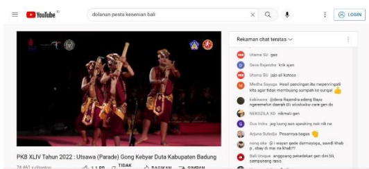
Gambar 4. Jejak digital live streaming Youtube Parade Gong Kebyar PKB 2022

Dinas Kebudayaan Bali melalui akun resmi youtubanya baru mulai meresponse peluang digitalisasi ini sejak tahun 2021, sedikit lebih lambat jika dibandingkan dengan channel yang lainnya, namun upaya ini harus tetap diberikan apresiasi dengan demikian data dokumentasi terkait dengan permainan tradisional yang digarap ulang melalui pertunjukan dolanan anak masih dapat dinikmati dan ditonton oleh masyarakat yang ada diluar Bali, tidak hanya berupa rekaman yang diupload saja, bahkan masyarakat dapat merasakan euphoria pementasan tersebut secara realtime melalui siaran langsung yang disiarkan di Youtube.