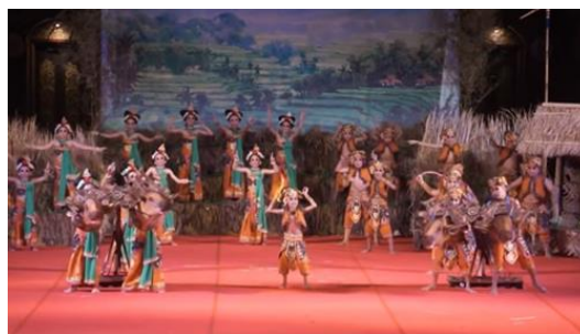
Gambar 1. Permainan Metekap-tekapan

Permainan tradisional sebagai warisan budaya bangsa dan warisan dari nenek moyang yang keberadaannya harus dilestarikan. Upaya pelestarian permainan tradisional ini salah satunya dilakukan melalui pertunjukan Dolanan anak pada Pesta Kesenian Bali. Beberapa permainan tradisional yang disajikan pada Dolanan Anak di PKB sebagian besar mengadopsi permainan tradisional dengan menggunakan alat yang digunakan sebagai property, antara lain adalah permainan metekap-tekapan, permainan khas dari daerah Badung, dimana anak berpura-pura melakukan permainan balapan sapi, apabila pada permainan tradisional yang asli sapi tidak divisualisasikan sebagai bentuk sapi, melainkan anak-anak yang berperan menjadi sapi tanpa menggunakan property berupa kepala sapi, dan ada pula yang berperan menjadi penunggang sapi, seperti yang tergambar pada gambar berikut ini: