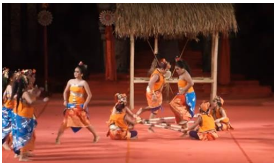
Gambar 2. Permainan megejagan

Pesta kesenian Bali terbukti menjadi salah satu ajang penting dalam melestarikan permainan tradisional daerah. Anak-anak yang tadinya tidak mengenal jenis permainan tradisional dapat mengetahui dan memainkannya kembali setelah menonton pementasan. Apabila dihitung tidak kurang dari 20 hingga 30 permainan tradisional yang dimainkan dalam pertunjukan dolanan yang diiringi gong kebyar anak-anak pada setiap eventnya. Masing – masing penampil dari Sembilan duta kabupaten memiliki dolanan unik yang ditampilkan dan dikreasikan dalam bentuk yang baru dan segar karena terbungkus dalam pertunjukan yang menarik. Perkembangan yang sangat signifikan ini menjadi jawaban akan kekhawatiran akan tersingkirnya permainan tradisional dikalangan anak-anak, permainan tradisional tetap lestari dan terwariskan dengan baik antar generasi.