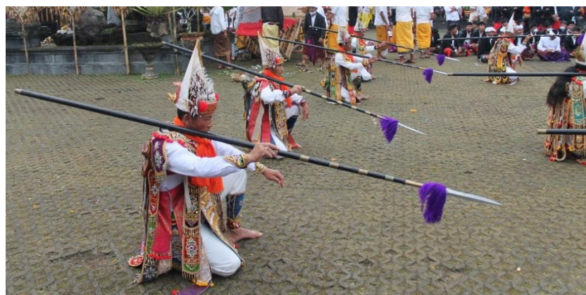
Gambar 2. Gerakan penari Baris ketika jongkok masuk pada bagian dua

dimedan peperangan. Adegan peperangan dilanjutkan pada gerakan berjongkok seperti mengintip musuh kemudian perlahan berdiri dengan gerakan yang seolah-olah seperti mengintip dan dilanjutkan dengan saling menusukan tombak pada bagian samping pinggang, kemudian dilanjutkan pada gerakan ngoyod berputar bertukar posisi antara kelompok depan dan kelompok belakang kemudian mengulangi gerakan yang sama pada posisi penari yang sudah berpindah.