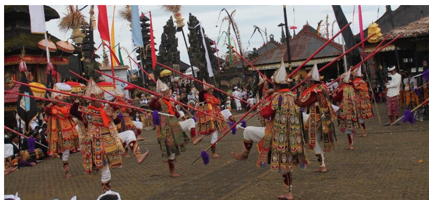
Gambar 3. Gerakan penari berhadapan dan saling menghunuskan tombak

peperangan dilanjutkan pada gerakan yang seolah-olah seperti mengintip dan dilanjutkan dengan saling menusukan tombak pada bagian samping pinggang, kemudian dilanjutkan pada gerakan ngoyod berputar bertukar posisi antara kelompok kanan dan kelompok kiri kemudian mengulangi gerakan yang sama pada posisi penari yang sudah berpindah.