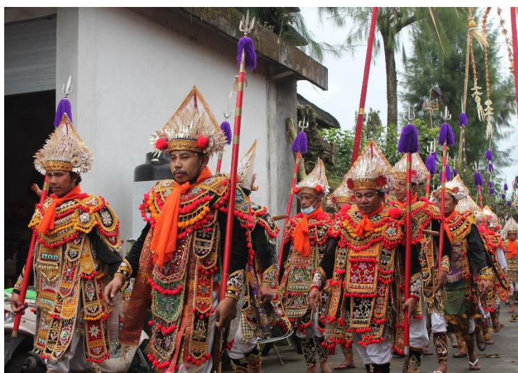
Gambar 6. Peran laki-laki dalam memperkenalkan pertunjukan tari Baris pada prosesi Nyenuk

transmisi atau pewarisan kebudayaan. Hal ini sejalan dengan pernyataan Parsons (1953:5-6) bahwa "dalam pemahaman terkait kebudayaan terdapat tiga aspek yang perlu untuk dipetakan yakni; (1) kebudayaan dipandang sebagai suatu warisan yang berharga, maka dari itu keberlangsungannya hingga saat ini merupakan hasil dari pengalihan secara turun-temurun; (2) kebudayaan dipandang sebagai wujud dari tindakan manusia yang keberlangsungannya bernilai untuk peningkatan kualitas hidup dari suatu masyarakat, maka dari itu kebudayaan senantiasa di pelajari bersama, hal tersebut dikarenakan kebudayaan bukanlah pengejawantahan bersifat genetik namun tumbuh bersama pada lingkup sosial; dan (3) kebudayaan senantiasa dimiliki serta dihayati keberlangsungannya secara bersama oleh warga masyarakat pendukungnya (Cahyono, 2016). Mangacu pada bahasan yang dikemukakan Parsons, dipahami secara tersirat bahwa proses kebudayaan terjadi melalui usaha pengalihan dari pendidik dan penerimaan yang bertalian dengan substansi tertentu (kebudayaan) dengan tujuan agar dapat dijadikan sebagai suatu warisan sosial yang bermakna untuk pedoman hidup.