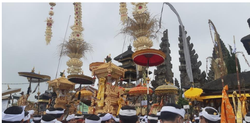
Gambar 4. Kegiatan Ngayah sebagian besar didominasi oleh peran laki-laki

Persepsi bahwa maskulinitas relatif tanpa cita-cita hegemonik mengarah pada asumsi bahwa laki-laki dapat memikul tanggung jawab yang lebih besar jika mereka ditugaskan untuk kegiatan sosial skala besar. Pada upacara Ngusaba Kadasa di Pura Ulundanu Batur, kegiatan berlangsung tidak sebentar melainkan berlangsung selama 12 hari, dimana kegiatan persembahyangan dapat berlangsung selama 24 jam yang dilakukan oleh seluruh masyarakat Bali secara silih berganti. Tentu untuk memfasilitasi hal tersebut, peran warga laki-laki di Desa Adat batur sangat dibutuhkan sebagai pegayah sepiritual ( pemangku ), pegayah dalam mempersiapkan sarana upacara upakara ( Jero Batu Barak dan