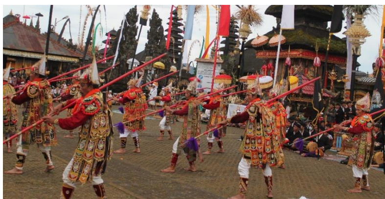
Gambar 1. Gerakan penari Baris ketika memasuki tempat pementasan

kemudian menoleh kekanan dan kekiri sembari meluruskan barisan dengan penari yang lain, kemudian dilanjutkan dengan gerakan nanjek . Gerakan berikutnya yakni gerakan duduk dengan posisi tombak berada di samping penari, setelah itu perlahan berdiri dengan mengucapkan kata “ puh,,, ” dilakukan serentak oleh penari yang di barengi dengan gerakan ngoyod dan ngedebeg dua kali, setelah itu mencari posisi berjajar saling berhadapan kemudian mengucapkan kata “ puh,,, dan aiihh,,, ”.