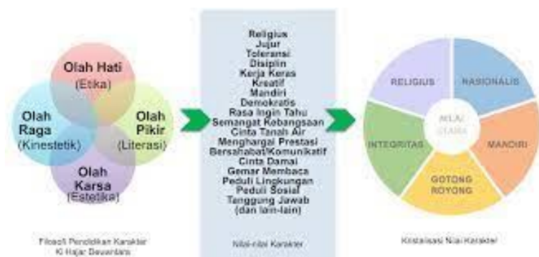
Gambar 3. (Pengebangan Nilai-Nilai Karakter). https://www.websitependidikan.com/2017

Nilai Pendidikan Tari Bedhayan Gagrag Sumirat Puspito, digunakan metode penelitian ini menggunakan Milles and Huberman Penerapan Sistem pembelajaran serta dalam sinerginya dalam Al Islam Kemuhmadyahan, dalam sinerginya dalam Al Islam Kemuhmadyahan yang diterapkan dalam nilai Pendidikan karakter Dekonstruksi ini hadir sebagai dasar penciptaan Tari Bedhayan Gagrag Sumirat Puspito.