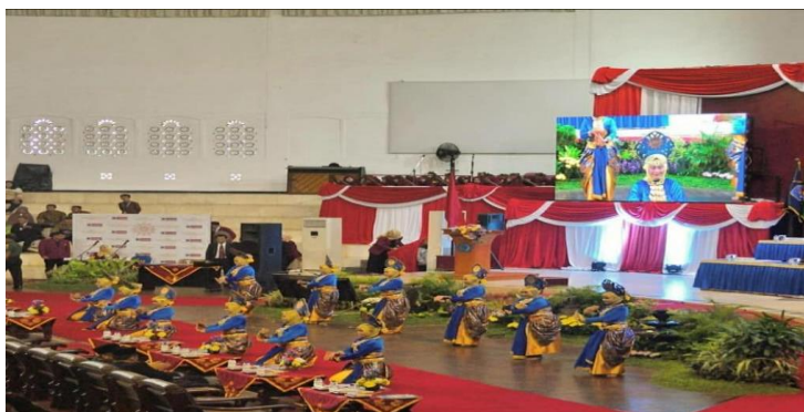
Gambar 2. Tari bedhayan gagrag sumirat puspito

Ragam gerak dalam tari dapat diidentifikasi dengan unsur gerak, motif gerak dan frase gerak sehingga terangkai secara keseluruhan menjadi kalimat gerak.