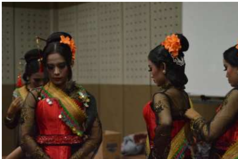
Gb.25 Para penari saling membantu merias diri