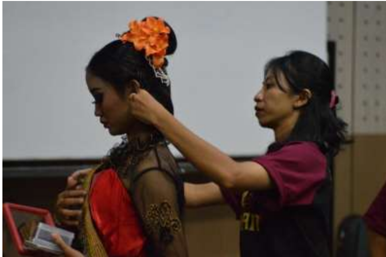
Gb. 24 Secara cermat perias menata rias busana penari