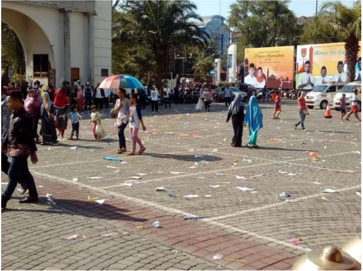
Gambar 51. Suasana area festival dugderan yang meninggalkan sampah