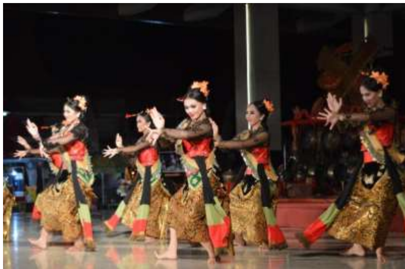
Gb. 31 Ragam gerak sendi penggalan kedua