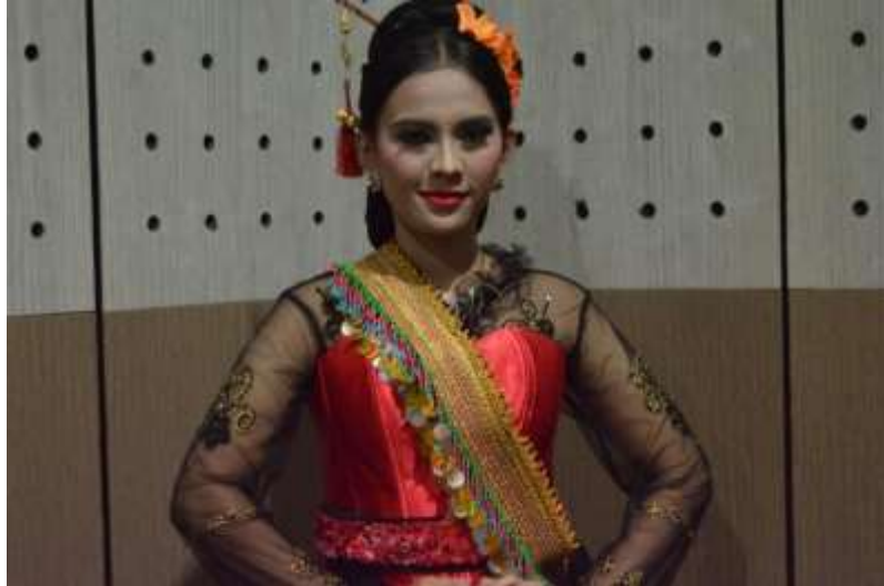
Gb. 26 Finalisasi rias wajah dan rias busana tari Dugderan

Saat pertunjukan merupakan bagian yang penting dalam sebuah pertunjukan Dugderan. Saat pertunjukan merupakan peristiwa pertunjukan inti yang menjadi pusat perhatian semua penonton pertunjukan. Pertunjukan tari Dugderan dipentaskan dalam acara Hari Tari Sedunia pada tanggal 29 April 2018 yang diselenggarakan di Kampung Budaya UNNES. Gerak-gerak yang kenes, gemulai, lincah, dan dinamis dipergelarkan. Gerak-gerak yang berkarakter tari pesisiran sebagai sebuah model tari Semarangan.