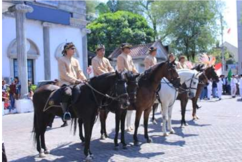
Gb.5 Pasukan kelompok berkuda siap mengamankan perjalanan

Kelompok Polwiltabes Semarang berpakaian Prajurit Jawa dan menunggang kuda dengan gagah dan siap mengiringi acara arak-arakan sampai selesai dan berada paling depan. Kelompok ini dinamakan kelompok pasukan berkuda. Tugas kelompok pasukan berkuda bertugas sebagai cucuk lampah, yaitu membuka dan mengamankan jalan untuk pasukan inti dan kelompok yang lainnya.