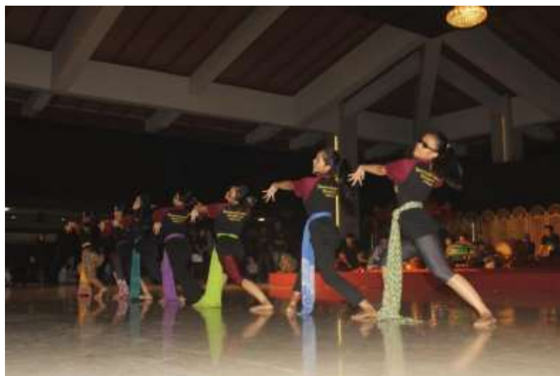
Gb. 18 Tahap iluminasi-pembentukan gerak yang masih kasar dan terpotong untuk disatukan menjadi gerak yang utuh

Tahap iluminasi-pembentukan , pada tahap ini sensitivitas dan sensibilitas menjadi sangat penting, yaitu bagaimana mengendapkan gagasan yang membekas pada kognisi kegelisahan seniman. Tahap presentasi-pementasan, pada tahap ini merupakan proses kreatif penciptaan seni telah selesai dan atau mencapai pada tahap penyusunan konsep dan bentuk untuk dipresentasikan di depan khalayak penikmat. Terakhir tahap evaluasi, tahap ini menjadi pemikiran, konsep maupun bentuk karya tari yang secara holistik, sehingga mencapai keselarasan yang harmonis antara ide, bentuk, dan sumber gagasan koreografi Dugderan.