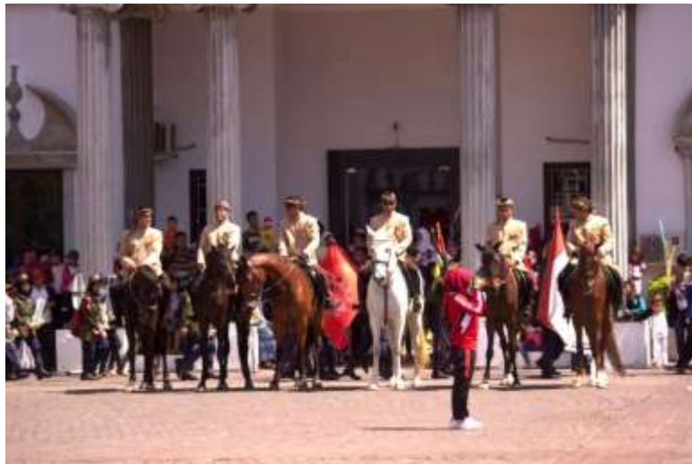
Gb. 8 Pasukan kelompok berkuda yang berjumlah enam orang mempersiapkan diri berjejer