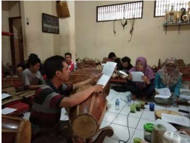
Gb. 15 Proses eksplorasi dan improvisasi juga dilakukan dengan rangsang tembang atau lagu

Tahap eksperimen, dalam tahap ini peneliti menggunakan metode eksperimen yang dilakukan dengan cara percobaan atau mencoba beberapa kemungkinan garap gerak. Kemungkinan garap gerak terutama pada garap gerak yang mengarah pada koreografi Dugdheran dalam bentuk garap baru dengan pola yang berbeda, sebagai tawaran sajian apresiasi dan kreasi pada generasi muda. Tentunya dengan memilih dan memilah gerak yang sesuai dengan karakter gerak tari Semarang yang lincah dan kenes yang banyak disukai para remaja putri.