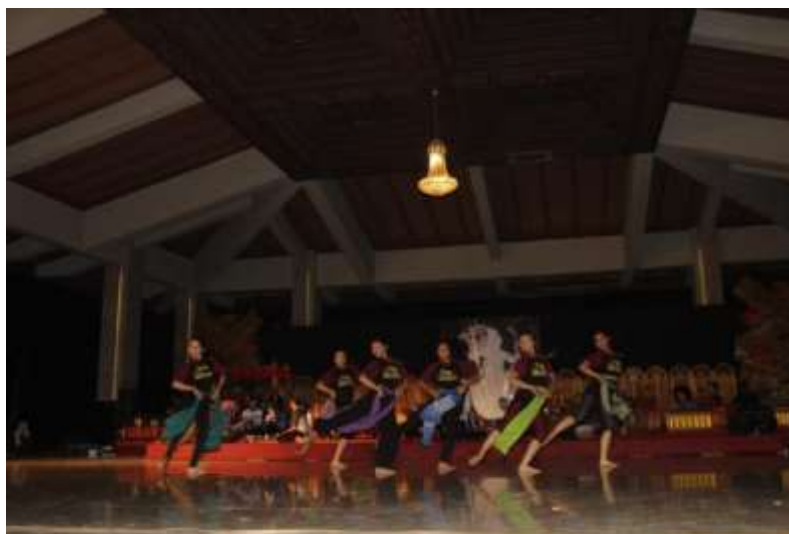
Gb. 19 Tahap iluminasi-pembentukan gerak juga dilakukan dengan memadukan gerak