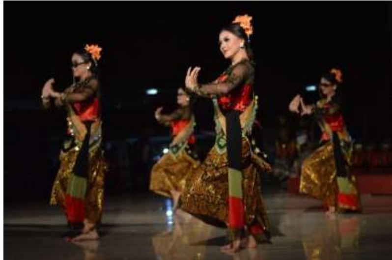
Gb. 36 Ragam gerak pokok keempat tari Dugderan dengan karakter lincah

Bagian yang juga penting dalam pertunjukan Dugderan adalah setelah pertunjukan itu sendiri. Bagian ini merupakan fase penurunan dalam sebuah pertunjukan Dugderan. Setelah hingar bingar pertunjukan telah digelar, pertunjukan setelah pertunjukan itu sendiri menjadi daya tarik tersendiri. Kelelahan, keceriaan, kekecewaan mungkin bisa terjadi setelah pertunjukan berlangsung. Pertunjukan setelah pertunjukan ini juga merupakan tahap evaluasi dan koreksi diri para penari, koreografer, dan pendukung lainnya. Peristiwa setelah pertunjukan ini merupakan daya tari tersendiri bagi penonton. Penari dan penonton kadang berbaur menjadi satu dalam panggung meluapkan kegembiraan setelah pertunjukan berlangsung dan sukses.