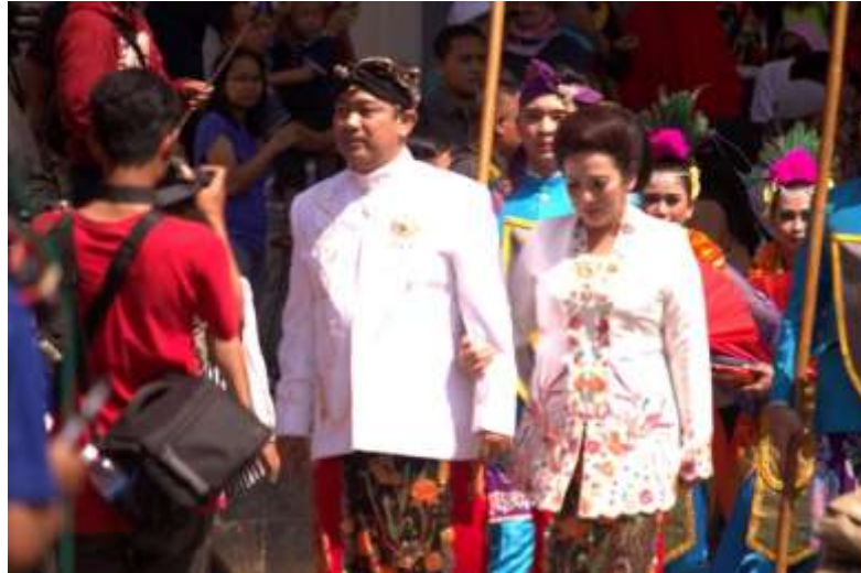
Gb. 3 Bapak Walikota beserta Ibu siap mengikuti arak-arakan Dugderan