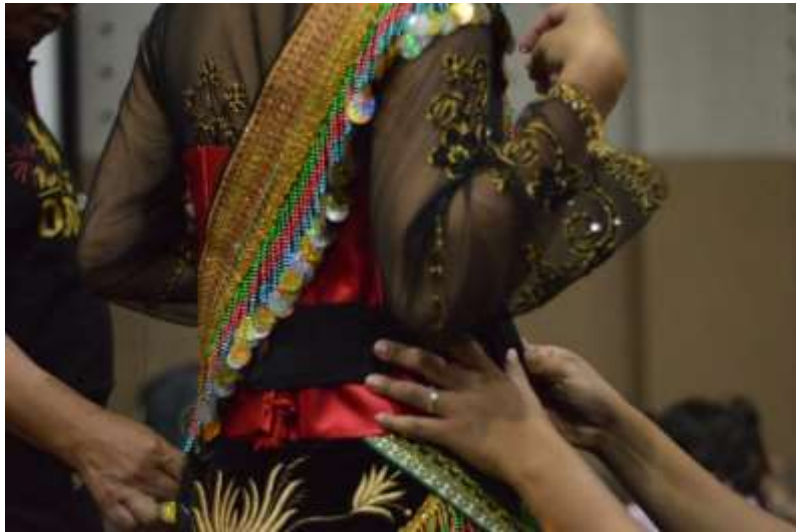
Gb. 22 Aktivitas menata rias busana