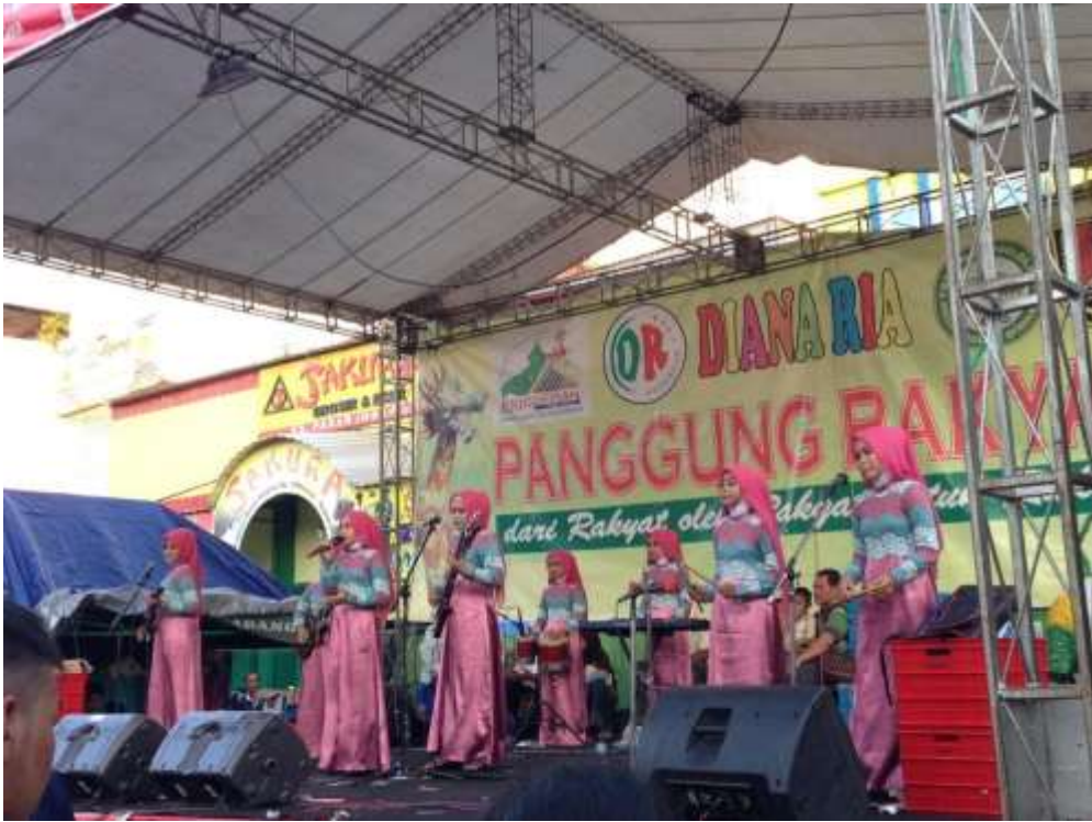
Gambar 48. Performance grup qasidah Tanpa Nama