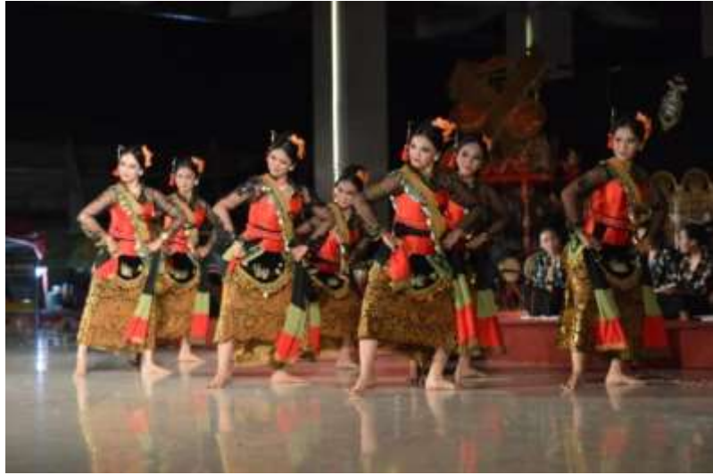
Gb. 28 Ragam gerak pancatan kacak pinggang mendak