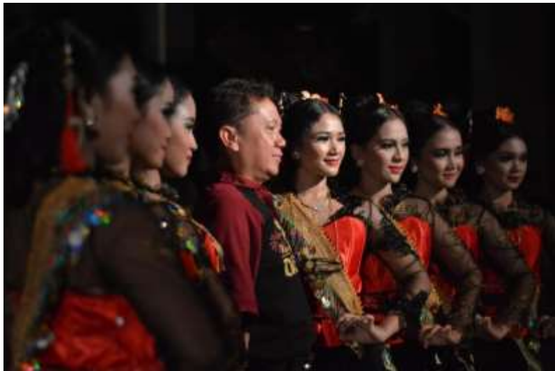
Gb. 42 Koreografer dan para penari foto bersama setelah pertunjukan usai