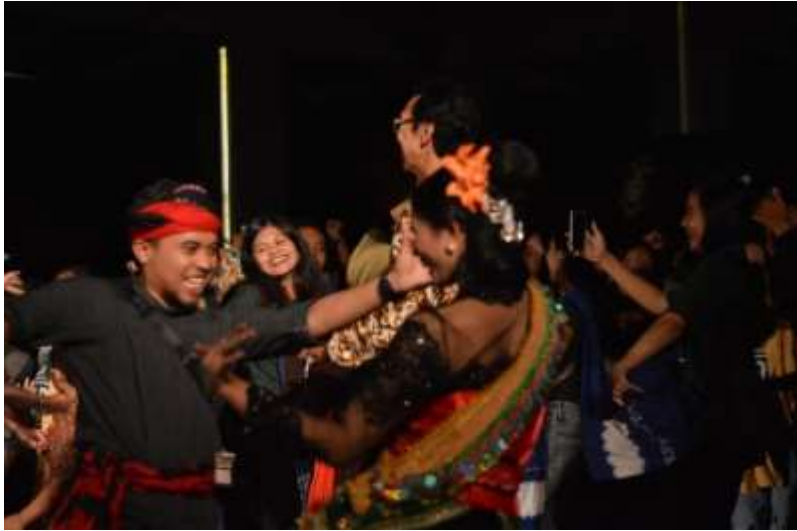
Gb. 37 Penari dan penonton berjoged bersama dalam satu panggung