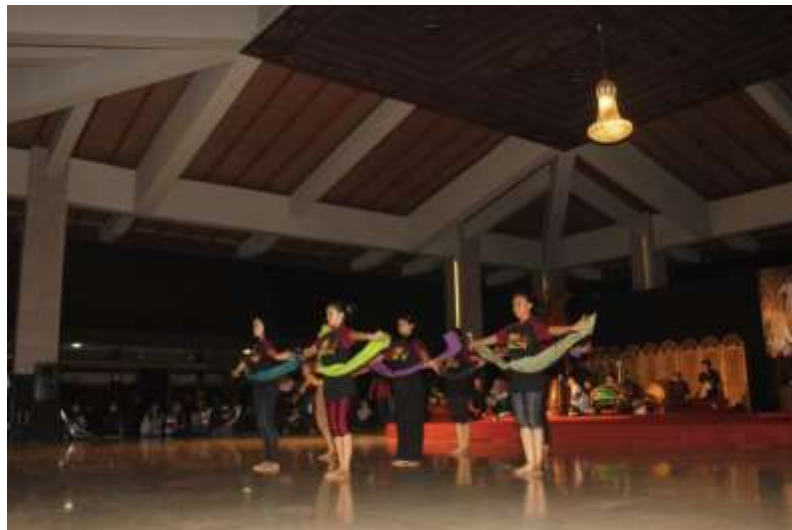
Gb. 16 Eksperimen gerak dengan menggunakan properti sampur

Tahap eksperimen, dalam tahap ini peneliti menggunakan metode eksperimen yang dilakukan dengan cara percobaan atau mencoba beberapa kemungkinan garap gerak. Kemungkinan garap gerak terutama pada garap gerak yang mengarah pada koreografi Dugdheran dalam bentuk garap baru dengan pola yang berbeda, sebagai tawaran sajian apresiasi dan kreasi pada generasi muda. Tentunya dengan memilih dan memilah gerak yang sesuai dengan karakter gerak tari Semarang yang lincah dan kenes yang banyak disukai para remaja putri.