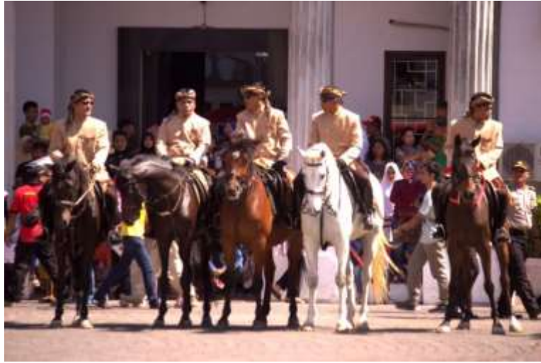
Gb.7 Pasukan kelompok berkuda berjejer siap untuk berangkat arak-arakan