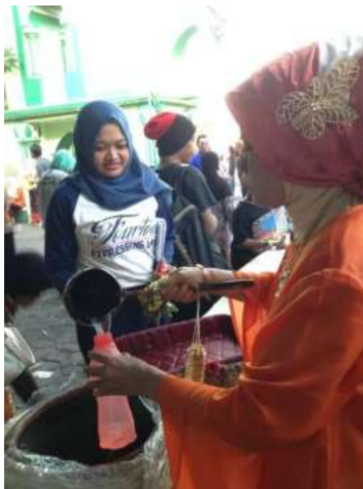
Gambar 47. Pembagian air yang sudah didoakan oleh wali