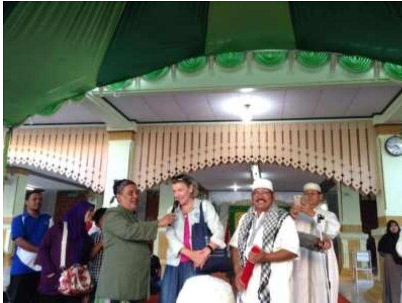
Gambar 46. Turis dari Amerika yang sedang diwawancarai karena tertarik dengan acara Dugderan