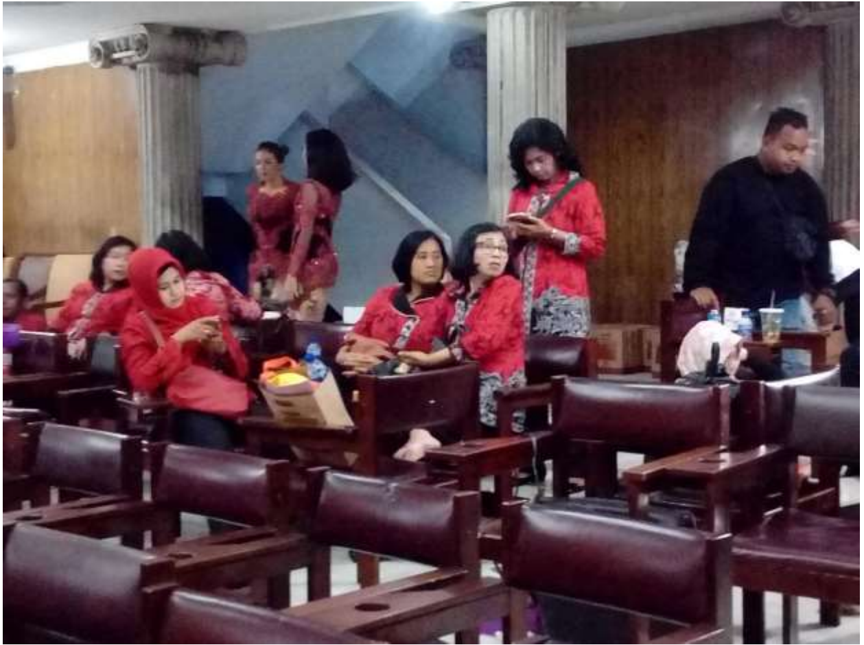
Gambar 50. Ibu-ibu sie konsumsi yang beristirahat sejenak setelah seharian penuh menyiapkan konsumsi acara