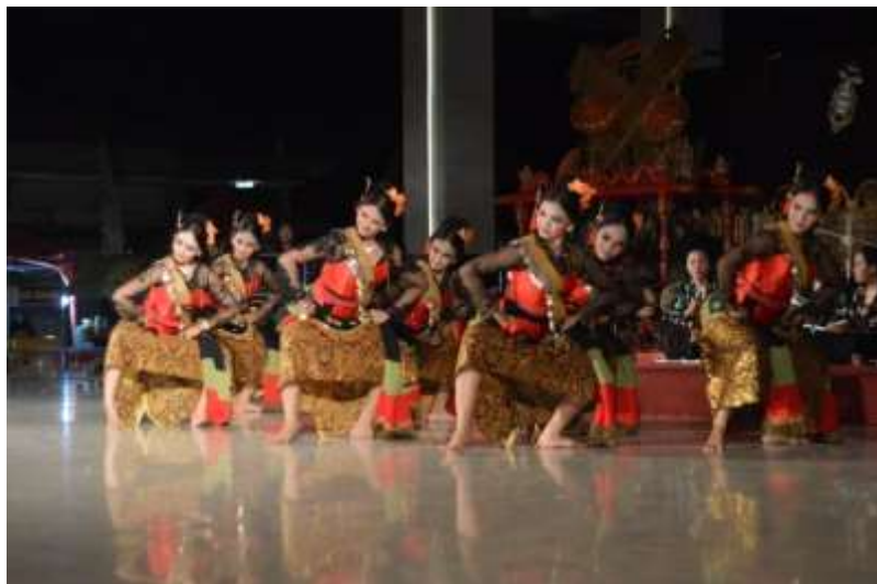
Gb. 29 Ragam gerak mendak toleh depan