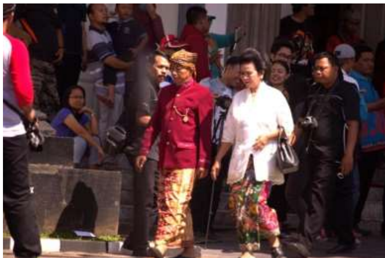
Gb.4 Para pejabat pemerintah kota Semarang bersiap mengikuti arak-arakan