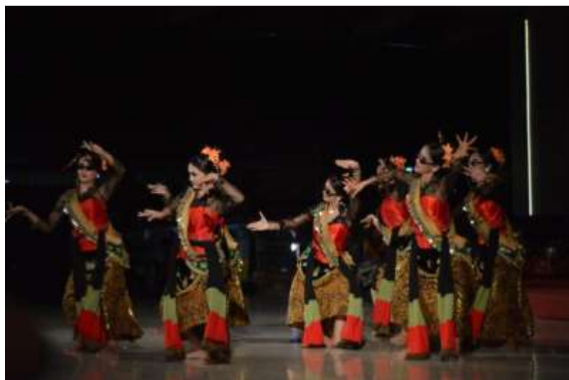
Gb. 35 Ragam gerak pokok ketiga dengan karakter kenes