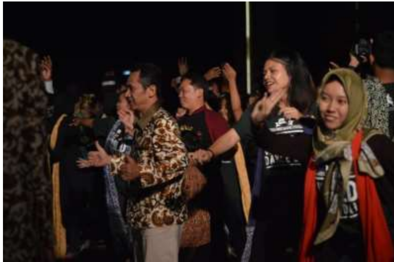
Gb. 39 Luapan kegembiraan terpancar dari para penonton setelah pertunjukan usai