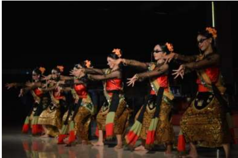
Gb. 34 Ragam gerak pokok kedua dengan karakter gerak yang tegas