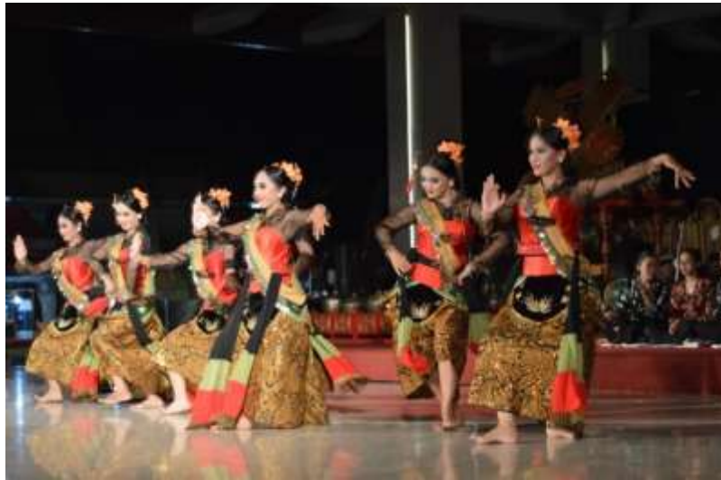
Gb. 30 Ragam gerak sendi penggalan pertama