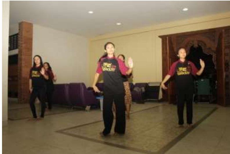
Gb. 13 Eksplorasi dan improvisasi gerak untuk menghasilkan gerak lenggang