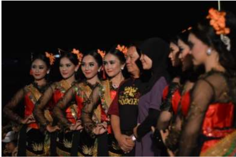
Gb. 43 Puas dan lega yang dirasakan koreografer dan penari setelah pertunjukan usai