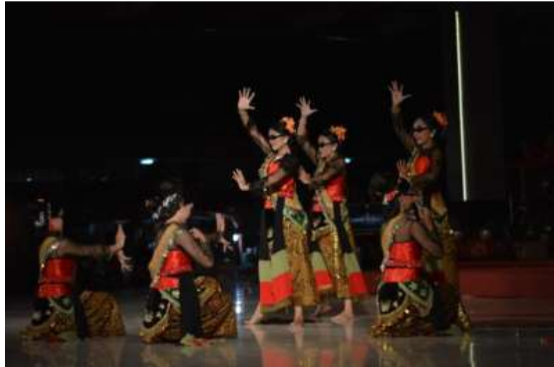
Gb. 33 Ragam gerak pokok pertama dengan variasi level gerak