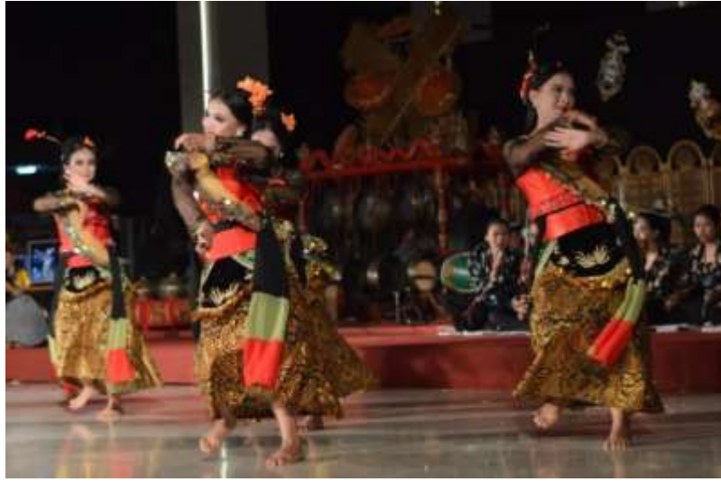
Gb. 32 Ragam gerak sendi penggalan ketiga