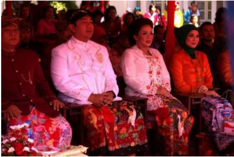
Gb.1 Bapak Walikota beserta Ibu selalu hadir dalam acara Dugderan