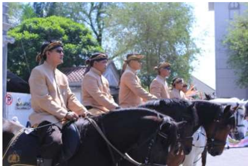
Gb. 6 Pasukan kelompok berkuda diperankan oleh anggota kepolisian dari Polwiltabes Semarang