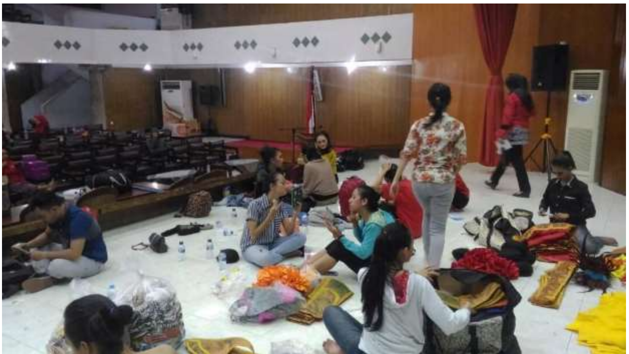
Gambar 49. Para pengisi acara menghapus make up riasan