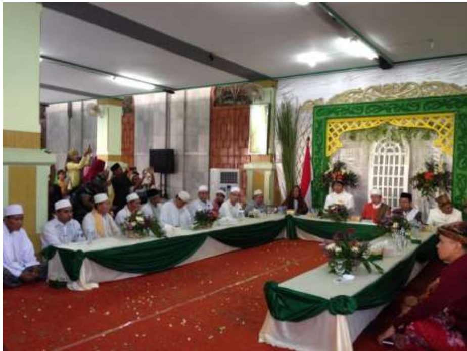
Gambar 44. Acara Khalakaf