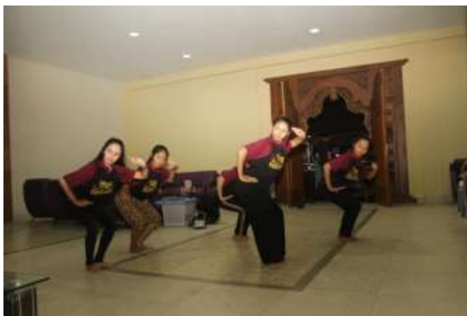
Gb. 11 Penari melakukan proses eksplorasi dan improvisasi gerak level sedang