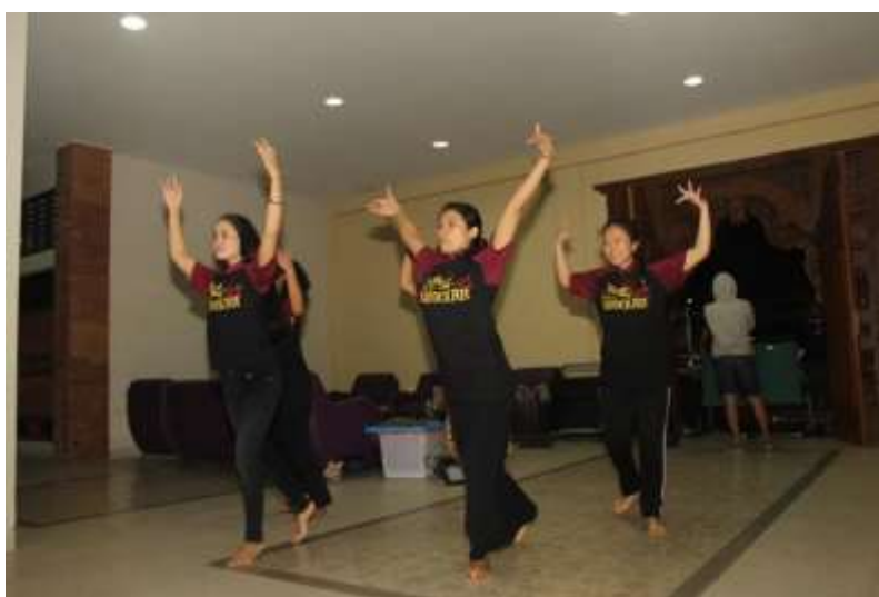
Gb. 12. Para penari sedang melakukan eksplorasi dan improvisasi berbagai kemungkinan gerak