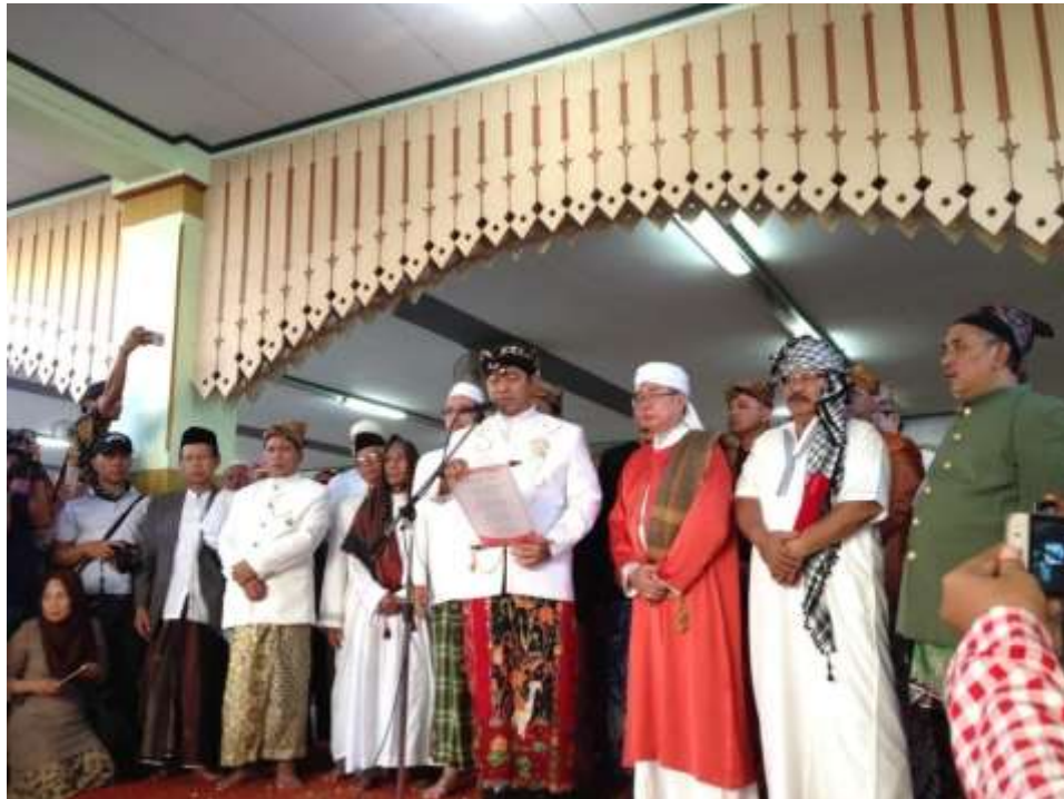
Gambar 45. Pembacaan hasil Khalakaf