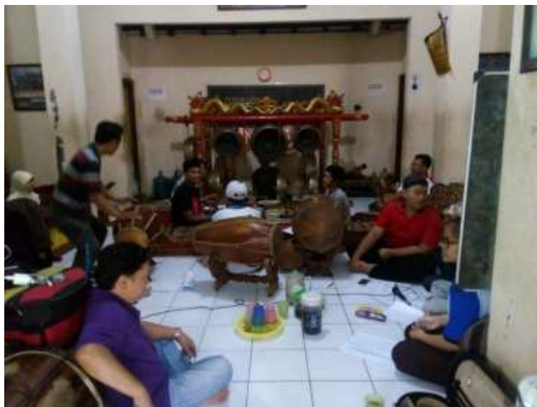
Gb. 14 Melalui rangsang dengar dengan memainkan gending juga dilakukan dalam proses eksplorasi dan improvisasi gerak