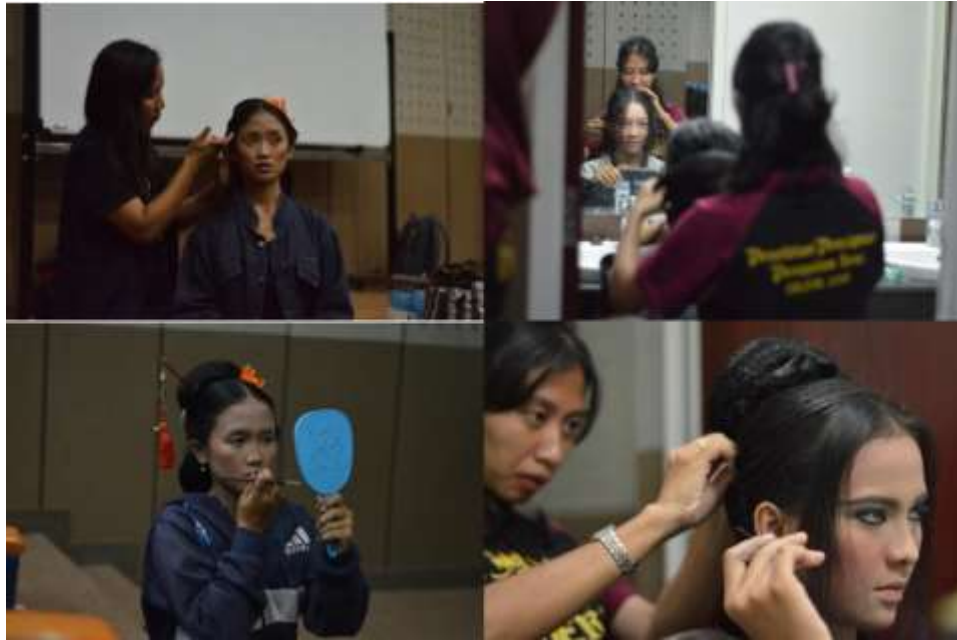
Gb. 20 Para penari sedang mempersiapkan diri dengan merias wajah