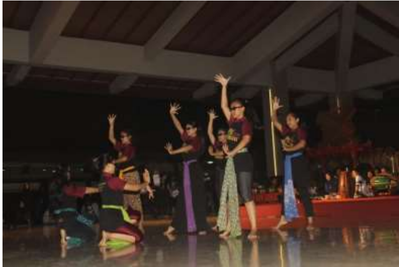
Gb. 17 Eksperimen gerak dengan menggunakan properti kaca mata

Tahap iluminasi-pembentukan , pada tahap ini sensitivitas dan sensibilitas menjadi sangat penting, yaitu bagaimana mengendapkan gagasan yang membekas pada kognisi kegelisahan seniman. Tahap presentasi-pementasan, pada tahap ini merupakan proses kreatif penciptaan seni telah selesai dan atau mencapai pada tahap penyusunan konsep dan bentuk untuk dipresentasikan di depan khalayak penikmat. Terakhir tahap evaluasi, tahap ini menjadi pemikiran, konsep maupun bentuk karya tari yang secara holistik, sehingga mencapai keselarasan yang harmonis antara ide, bentuk, dan sumber gagasan koreografi Dugderan.