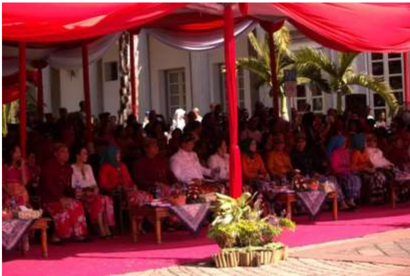
Gb. 2 Bapak Ibu pejabat di lingkungan Pemerintah Kota Semarang juga hadir dalam acara Dugderan