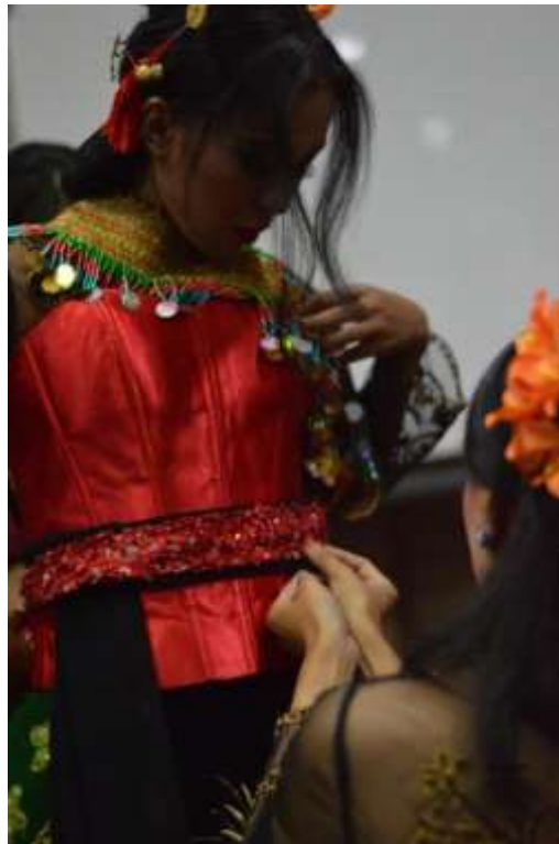
Gb. 23 Para penari saling membantu menata rias busana