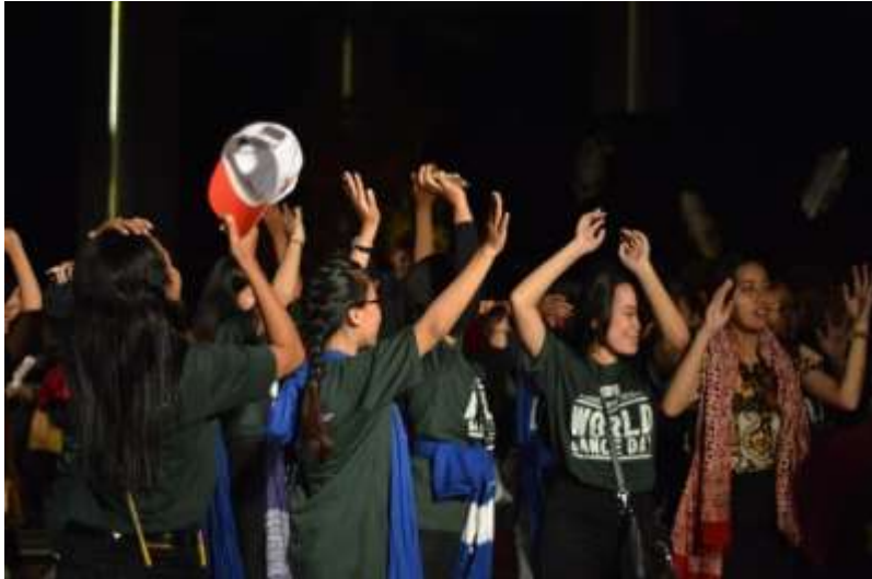
Gb. 41 Para kru pendukung manajemen produksi pertunjukan ikut berjiged ria