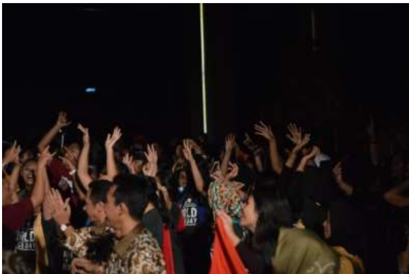
Gb. 40 Penonton bergembira ria joged bersama setelah pertunjukan usai