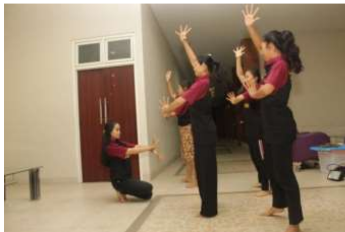
Gb. 10 Penari melakukan proses eksplorasi dan improvisasi gerak level rendah dan tinggi

Gerak dari berbagai rangsang tersebut diolah melalui eksplorasi dan improvisasi gerak sampai terwujud gerak yang diinginkan koreografer. Gerak hasil proses pencarian melalui eksplorasi dan improvisasi dipilah dan dikelompokkan berdasarkan karakter gerak masing-masing. Gerak-gerak ini masih bersifat sementara, masih kasar, dan berbentuk motif-motif gerak yang perlu disusun menjadi frase gerak dan kalimat gerak.