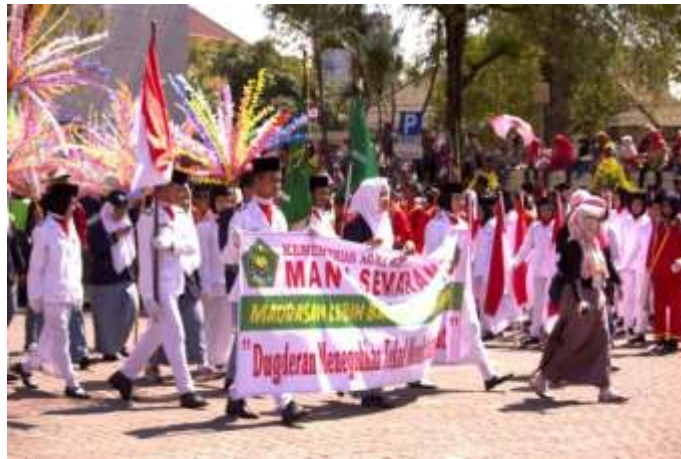
Gb. 9 Kelompok Paskibraka saat mempersiapkan diri dalam upacara Dugderan

Kelompok paskibraka berbaris dengan rapi berada dibarisan kedua untuk memimpin jalannya arak-arakan dan para kelompok paskibraka membuka bendera Merah Putih dan berpakaian putih-putih. Kelompok paskibraka adalah para pilihan yang sudah ditunjuk untuk memeriahkan acara pertunjukan arak-arakan.