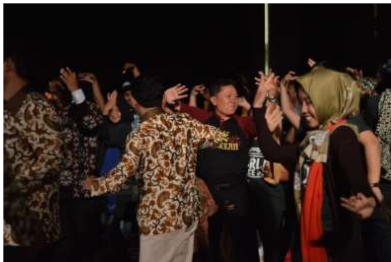
Gb. 38 Para pejabat sebagai penonton juga berbaur bersama dengan penari dan koreografer Dugderan