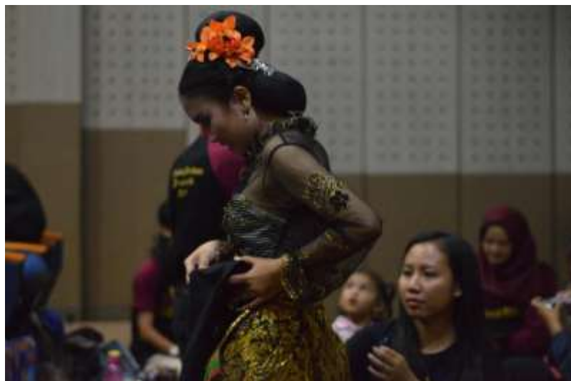
Gb. 21 Aktivitas mempersiapkan diri sebelum pertunjukan