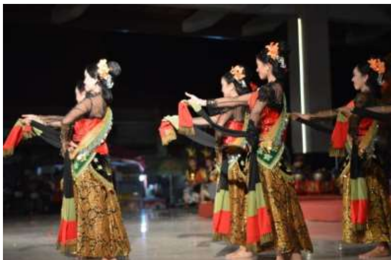
Gb. 27 Ragam pertama gerak Dugderan

Saat pertunjukan merupakan bagian yang penting dalam sebuah pertunjukan Dugderan. Saat pertunjukan merupakan peristiwa pertunjukan inti yang menjadi pusat perhatian semua penonton pertunjukan. Pertunjukan tari Dugderan dipentaskan dalam acara Hari Tari Sedunia pada tanggal 29 April 2018 yang diselenggarakan di Kampung Budaya UNNES. Gerak-gerak yang kenes, gemulai, lincah, dan dinamis dipergelarkan. Gerak-gerak yang berkarakter tari pesisiran sebagai sebuah model tari Semarangan.