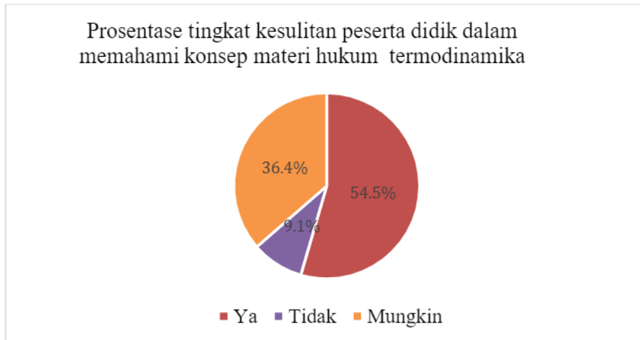
Gambar 3.1. Prosentase tingkat kesulitan peserta didik dalam memahami konsep materi hukum termodinamika.

Berdasarkan data hasil kuesioner diperoleh bahwa pada tingkat kesulitan yang dialami peserta didik dalam memahami konsep materi hukum termodinamika sebanyak 54,5% mengalami kesulitan, 36,4 % mungkin mengalami kesulitan dan 9,1 % sisanya tidak mengalami kesulitan seperti yang terlihat pada Gambar 3.1. Dari tabel terlihat secara jelas bahwa peserta didik lebih dari 50 % mengalami kesulitan dalam memahami konsep materi termodinamika, sehingga perlu Instrumen evaluasi yang tepat untuk mengetahui tingkat kesulitan peserta didik dalam memahami materi. Karena materi termodinamika merupakan salah satu materi pembelajaran fisika yang cukup sulit di SMA.