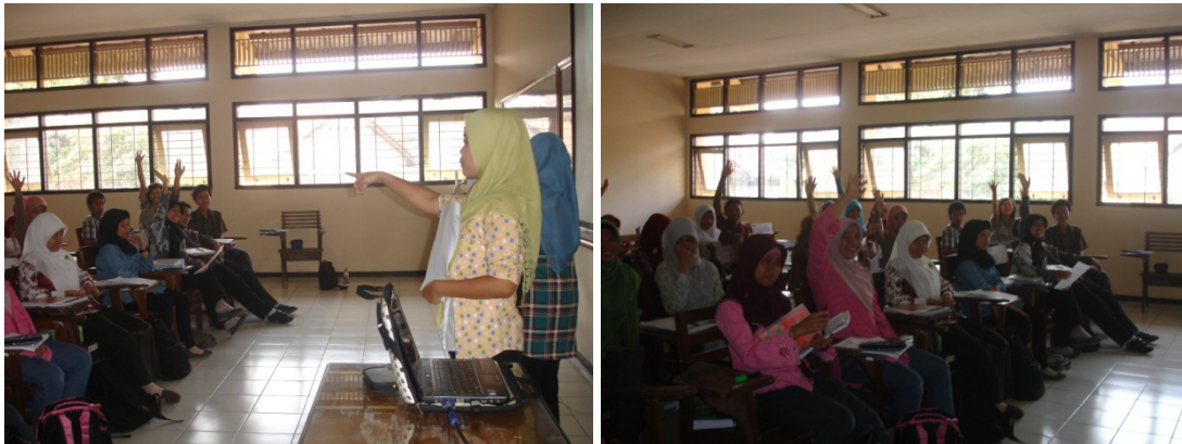
Gambar 3. Suasana pembelajaran setelah mahasiswa melakukan kegiatan eksplorasi melalui dunia maya dan dosen mengelaborasi melalui diskusi

Perkuliahan praktikum berlangsung sesuai tuntutan inkuiri dipandu oleh asisten dosen dari mahasiswa. Mahasiswa secara antusias (penuh rasa ingin tahu) melaksanakan tugas-tugas praktikumnya sebagaimana ditunjukkan dalam Gambar 4. Sayangnya ada satu perkuliahan praktikum yang tidak dihadiri oleh dosen sama sekali sehingga pada saat mahasiswa butuh penekanan konsep tidak ada yang memfasilitasi. Asisten dosen yang seorang mahasiswa ragu-ragu (dan tidak dapat dipertanggung jawabkan jawabannya) atas pertanyaan praktikan. Perlakuan mahasiswa terhadap hewan uji coba belum sepenuhnya memperlihatkan dipenuhinya prinsip konservasi, pemanfaatan secara bijak dan lestari. Hal ini luput dari perhatian asisten dosen. Demikian pula perilaku-perilaku