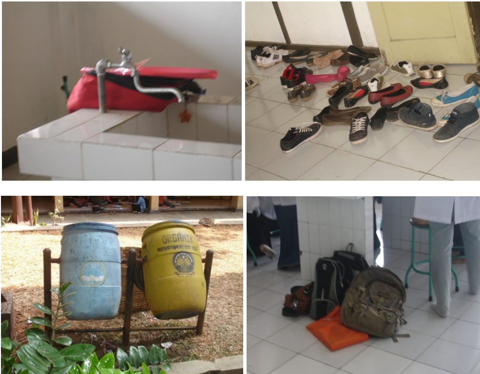
Gambar 5. Berbagai contoh perilaku yang kurang mencerminkan karakter disiplin, tanggung jawab dan peduli.

Perilaku lain yang kurang mencerminkan karakter konservasi adalah kurangnya perhatian kepada organisme untuk praktikum. Hewan coba (jangkrik) diletakkan di dalam kantongplastik tertutup rapat, dan diperlakukan tidak dengan kasih sayang. Tumbuhan yang telah diamati tidak dibuang pada tempatnya padahal tersedia bak sampah organik. Mahasiswa sebenarnya juga tahu bahwa perilakunya salah tetapi tidak dapat memberi alasan. Mereka hanya tersenyum sehingga peneliti menganggap hanya kemalasan dan kurang peduli saja terhadap organisme lain dan mengambil asumsi mungkin laboratorium harus memfasilitasi dengan memberi poster afirmatif atau peringatan agar praktikum yang menggunakan hewan dan tumbuhan diperlakukan dengan baik.