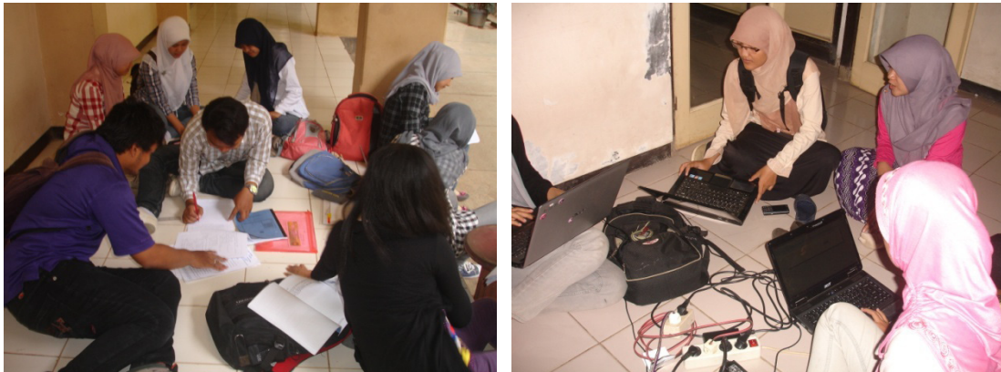
Gambar 2. Sekelompok mahasiswa berdiskusi dan berselancar di internet di teras gedung perkuliahan untuk menyelesaikan tugas/menyiapkan presentasi

teras-teras gedung perkuliahan (Gambar 2). Perkuliahan praktikum juga diawali secara disiplin oleh mahasiswa dipandu asisten dosen dari mahasiswa, semua berjas praktikum. Dosen dan presenter mahasiswa telah memulai dengan sapaan salam yang mengandung doa, assalamu alaikum warohmatullahi wabarokatuh (semoga keselamatan, rahmat dan barokah Allah senantiasa terlimpah kepada anda). Hal ini wujud karakter religius.