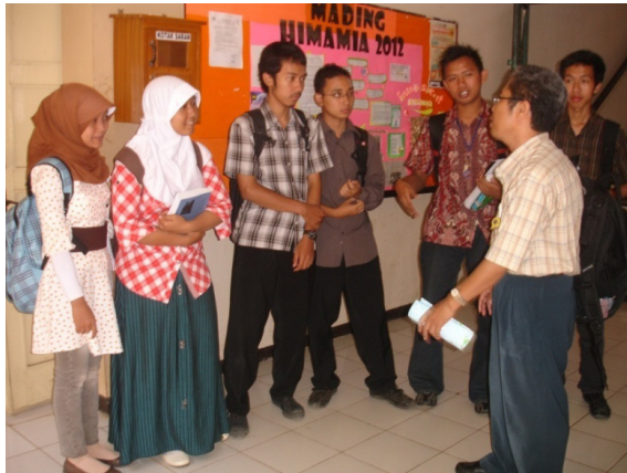
Gambar 6. Peneliti menjadi instrumen untuk mengungkap kesadaran belajar mahasiswa dengan kurikulum berbasis kompetensi dan konservasi

Mahasiswa angkatan 2012 yang belajar dengan kurikulum baru mengaku belum memahami sepenuhnya kata konservasi yang melekat pada visi Unnes. Mereka mengungkapkan saat program pengenalan akademik (PPA) belum merasa puas setelah diterangkan masalah konservasi. Setelah dikonfirmasi ketika mereka berpraktikum di laboratorium mengaku berperilaku sama seperti rombongan belajar lain sebagaimana peneliti ceritakan pada mereka.