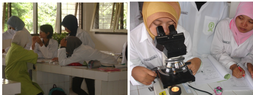
Gambar 4. Suasana kegiatan perkuliahan dengan praktikum di bawah koordinasi asisten dosen dari mahasiswa tingkat yang lebih tinggi

lain yang kurang menunjukkan karakter disiplin, santun, peduli dan tanggung jawab diperlihatkan mahasiswa. Beberapa mahasiswa mengeluarkan sapaan dan ucapan yang kurang baik terhadap temannya, meletakkan buku dan tas sembarangan, membiarkan tempat cuci alat dan bahan kotor, meletakkan sepatu tidak tertata (Gambar 5). Sebenarnya mereka tahu persis bahwa perilakunya salah dan dengan mudah mengatasinya. Meskipun demikian mereka tidak dapat memberi alasan atas perilakunya kecuali menyatakan tidak disediakan tempat. Tulisan ‘alas kaki harap dilepas’ yang ditampilkan sebagai salah satu tata tertib di laboratorium belum cukup jelas dan harus diberi tambahan ‘dan jejerkan dengan rapi’.