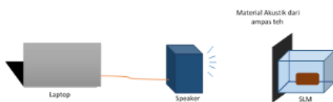
Gambar 2. Skema Alat Pengukuran Efektifitas Reduksi Kebisingan dengan Peredam

Nilai efektifitas reduksi kebisingan dihitung menggunakan Persamaan 1 (Setyo, 1998).