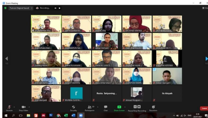
Gambar 2. Pelaksanaan Kegiatan Pelatihan E-Counseling Melalui Zoom Meeting

Kegiatan pengabdian ini dilaksanakan secara daring selama dua hari pada Hari Selasa, 27 Juli 2020 dan Rabu, 28 Juli 2021 pada pukul 08.00-16.00 WIB. Peserta dari kegiatan pengabdian ini adalah 25 konselor pendidikan alumni BK UNNES. Pelatihan dilaksanakan sinkron melalui zoom meeting dan asinkron melalui google classroom .