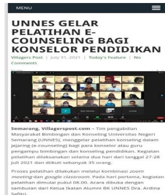
Gambar 3. Dokumentasi Berita Online tentang Kegiatan Pelatihan E-Counseling

Kegiatan pengabdian kepada masyarakat ini juga telah diberitakan pada kegiatan telah dipublikasikan melalui https://villagerspost.com/todays-feature/unnes-gelar-pelatihan-e-counseling-bagi-konselor-pendidikan/ , 2021 sebagaimana dokumentasi berikut.