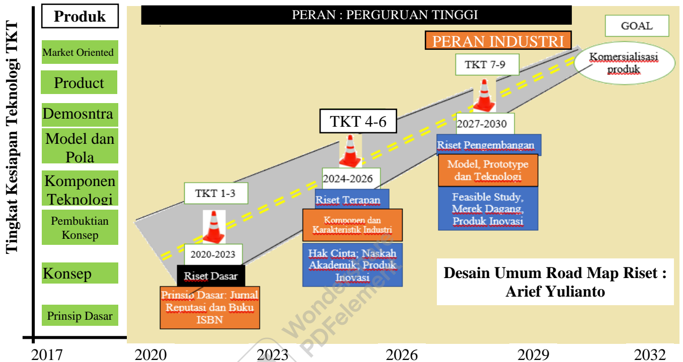
Gambar 1. Road Map Penelitian Utuh

Perusahaan seringkali mempunyai keterbatasan dengan pendanaan internal, sehingga harus mengakses pendanaan eksternal yang merupakan bauran debt dan equity atau disebut dengan capital structure. Dengan mengetahui faktor karakteristik perusahaan, khususnya firm size, maka dapat disusun naskah kebijakan public agar kredit perbankan dapat tersalurkan optimal kepada sektor riil. Apalagi ketika negara Indonesia cenderung sebagai bank-based system bukan market bank-system, yang kecenderungan supply dana lebih besar dari perbankan (La Porta et al., 1999; Warjiyo, 2015).