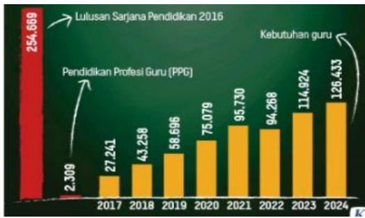
Gambar 1. Jumlah Sarana Pendidikan

pekerjaan untuk menjadi guru akuntansi atau ekonomi.