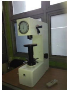
GAMBAR 1. Alat Pengujian Kekerasan Brinell

Pengujian dilakukan guna mengetahui sifat mekanik sampel yaitu kekerasan dan keausan bahan komposit. Uji kekerasan dilakukan dengan menggunakan metode Brinell . Sampel yang telah dicetak dilakukan penghalusan permukaan dan pemolesan agar diperoleh permukaan yang rata sehingga tekanan yang diberikan oleh alat uji dapat terdistribusi merata. Sampel diletakkan secara sentris terhadap alat uji dan dilakukan penekanan sampai sampel terlihat retak dan hancur. Tepat saat sampel terlihat retak dan hancur, dilakukan pembacaan dan pencatatan pada skala Brinell .