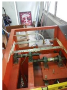
GAMBAR 2. Alat Pengujian Keausan

Dengan, BHN : Brinell Hardness Number, P : beban yang menekan (Kg), D : diameter penetrator (mm), d : diameter injakan penetrator (mm).