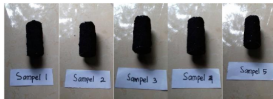
GAMBAR 3. Bahan Komposit yang Dihasilkan dengan Variasi Persentase Komposisi

Pada penelitian ini sampel yang digunakan berjumlah 5 sampel dengan persentase komposisi bahan yang berbeda-beda pada tiap sampelnya, ditunjukkan pada tabel 1. Bahan yang digunakan untuk membuat sampel antara lain arang kulit buah mahoni, arang tempurung kelapa, dan resin polyester. Penggunaan arang tempurung kelapa dimaksudkan untuk menambah tekstur kasar pada bahan komposit, sehingga tidak mudah terkikis. Berikut ini sampel bahan komposit yang dihasilkan dari proses karbonisasi dan proses pressing (kompaksi).