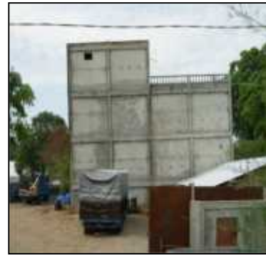
Gambar 2. Contoh beberapa kerusakan yang diakibatkan oleh likuifaksi