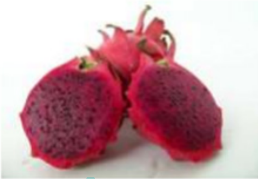
4 Gambar 2.1. Buah Naga Merah ( Hylocereus polyrhizus )

Pada bagian kulit buah naga merah, terkandung antosianin berjenis sianidin 3-ramnosil glukosida 5-glukosida, berdasarkan nilai Rf ( retrogradation factor ) sebesar 0,36-0,38, serta nilai absorbansi maksimal pada panjang gelombang dengan \lambda = 536,4 nm. Selain itu, buah naga merah juga kaya akan antioksidan, Buah naga mengandung vitamin C dan flavonoid, yang dapat juga digunakan sebagai bahan dasar pembuatan kosmetik, yang berfungsi untuk mencegah terjadinya kehilangan kelembapan pada kulit. Selain itu, kandungan antosianin pada buah naga merah juga merupakan salah satu bagian penting dalam kelompok pigmen setelah klorofil. Antosianin dapat larut dalam air, serta mampu menghasilkan warna, dari merah sampai biru. Warna tersebut dapat tersebar luas dalam buah, bunga, serta daun. Kandungan antosianin pada buah naga merah dapat ditemukan pada buah maupun kulitnya.