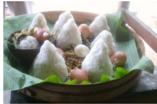
(Sumber: Dokumen Peneliti dari Selamatan di Kab. Wonogiri pada 2012)

Dari bagan tersebut dapat diketahui bahwa sign 'tanda' yang berupa nama tumpeng pitu [tumpəŋ pitu] menjadi penanda atas concept 'konsep' adanya permohonan keselamatan atas kehamilan yang telah mencapai usia tujuh bulan. Adapun significatum -nya adalah wujud konkret tumpeng tersebut. Di sini hubungan antara sign dan significatum tidaklah langsung (diantarai oleh adanya konsep atau concept ), sehingga hubungan itu dalam gambar diwujudkan dengan garis putus-putus (Lyons, 1977: 96-97). Yang dimaksud dengan hubungan tidak langsung adalah bahwa di sini tidak diharuskan adanya hubungan logis antara nama makanan yang diwujudkan dengan sign [tumpəŋ pitu] dan referen makanan yang berupa significatum -nya.