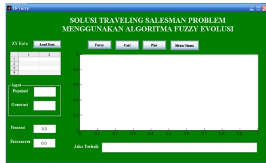
Gambar 2. Tampilan TSP

Koordinat semua titik dalam pendistribusian barang menuju rumah penerima barang yang telah diberikan oleh PT. Jalur Nugraha Ekakurir Semarang, kemudian dapat dicari jarak antar lokasi dalam penelitian ini. Dalam penelitian ini, perhitungan jarak antar lokasi dilakukan dengan bantuan Google Maps yang telah menyediakan fasilitas berupa pengukuran jarak. Setelah perangkat lunak kajian Algoritma Fuzzy Evolusi pada Travelling Salesman Problem selesai dibangun, maka tahap selanjutnya adalah tahap uji coba program. Tahap uji coba tampilan adalah tahap pengujian dengan menjalankan program Travelling Salesman Problem yang sebagai inputan adalah titik koordinat tempat tujuan, jumlah populasi dan batas generasi yang akan diproses. Dalam perangkat yang telah dibuat, terdapat beberapa tampilan antara lain: tampilan menu utama, tampilan TSP, tampilan ABOUT dan tampilan Help. Hasil pada tampilan menu utama, tampilan About dan tampilan Help. Tampilan TSP dapat dilihat pada Gambar 2.