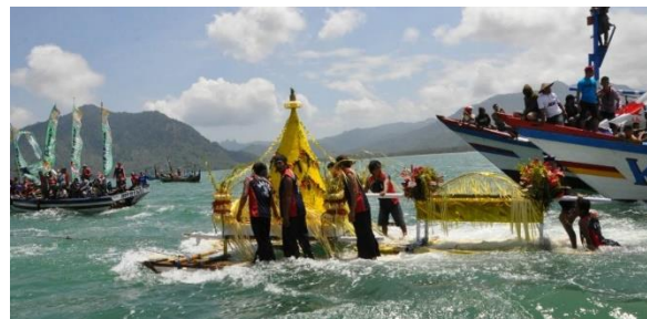
Gambar 2. Prosesi Sedekah Laut di Pantai Selatan

Oleh sebab itu, dikemudian hari hingga saat ini, disetiap Selasa Kliwon atau Jumat Kliwon bulan Muharam atau Syuro dalam penanggalan Jawa masyarakat pantai selatan melakukan ritual larung sesaji yang dimaksudkan sebagai ungkapan syukur akan berkah laut dan mendoakan akan keselamatan masyarakat serta dijauhkan dari mara bahaya dimasa yang akan datang (Suryanti, A. : 2008).