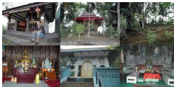
Gambar 3. Beberapa Petilasan di Gunung Selok

Nama Gunung Selok berasal dari kata Jungkring Seloko yang memiliki makna tempat dimana pangher gaib Nusantara berkumpul. Gunung Selok banyak dimanfaatkan oleh masyarakat sebagai tempat wisata alam dan wisata religi. Hal ini dapat dilihat dengan adanya beberapa petilasan yang dianggap memiliki kekuatan magis dan dapat memberikan berkah kepada siapa yang mengunjungi atau bahkan bersemedi di tempat tersebut.