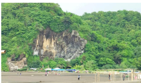
Gambar 5. Gunung Selok sebagai pemecah gelombang alami

Secara morfologis , gunung selok sebenarnya adalah sebuah bukit yang terisolasi dibagian bibir pantai dengan ketinggian hingga mencapai 150 MDPL yang dikelilingi oleh endapan pasir disekitarnya. Akibat adanya intrusi andesit yang mengalami retakan dan didukung oleh erosi sehingga membentuk beberapa gua yang tersebar di beberapa bagian Gunung Selok .