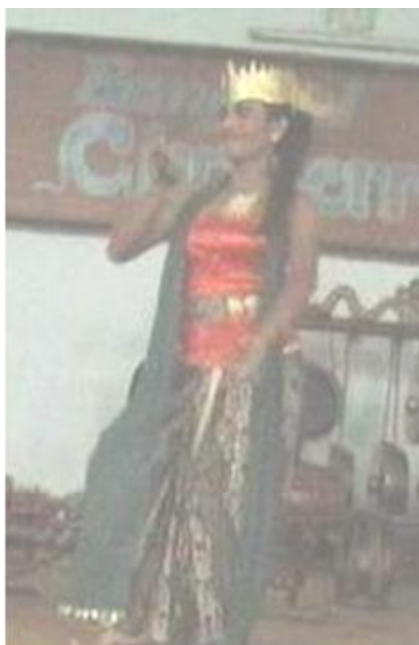
Foto 4.8 Ragam Gerak Lampah Ngrambat Seblak Sampur

Nilai keindahan gerak Lampah Ngrambat Seblak Sampur yang dilakukan oleh penari dengan gerak yang tegas jika dilihat dari tenaga yang dikeluarkan oleh penari tetapi masih terlihat lembut dan mengalir jika dilihat dari waktu yang digunakan. Penggunaan gerak kaki yang tidak begitu atraktif dan penggunaan level sedang pada gerak Lampah Ngrambat Seblak Sampur memberikan kesan gerak yang sederhana. Penggunaan volume yang lebar memberi kesan yang lincah pada gerak Lampah Ngrambat Seblak Sampur .