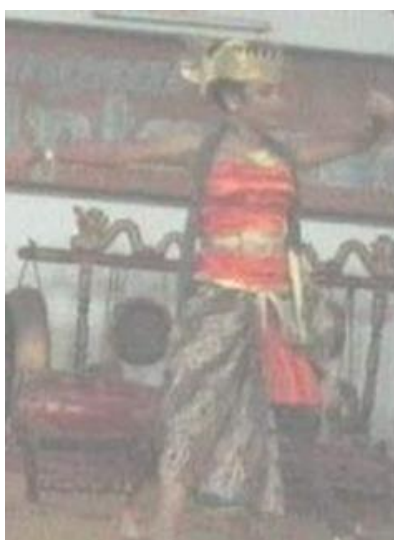
Foto 4.16 Ragam Gerak Mlaku Gagahan

Nilai keindahan gerak Mlaku Gagahan dilihat dari aspek waktu dapat dilihat dari ritme, tempo, dan durasi. Ritme yang digunakan pada gerak Mlaku Gagahan adalah sedang sehingga memberi kesan santai tetapi tidak mengurangi kesan gagah pada gerak. Tempo yang digunakan yaitu pelan sehingga memberi kesan santai pada gerak. Durasi yang digunakan pada gerak Mlaku Gagahan adalah 12 hitungan sehingga tidak memberi kesan yang membosankan pada penonton.