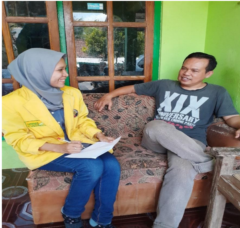
Gambar 5.1 proses wawancara dengan narasumber