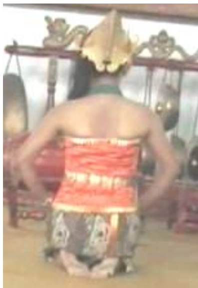
Foto 4.2 Ragam Gerak Turun Simpuh