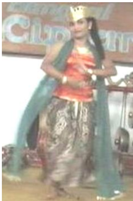
Foto 4.10 Ragam Gerak Wolak-walik Seblak

Gerak Wolak-walik Seblak yang dilakukan oleh penari terlihat tegas hal ini dapat dilihat dari penggunaan volume yang lebar, intensitas serta penekanan pada gerak yang tinggi sehingga memberi kesan tegas pada gerak. Tidak hanya tegas pada gerak Wolak-walik Seblak penari juga terlihat anggun karena menggunakan level sedang. Penggunaan ritme dan tempo yang cepat memberi kesan lincah pada gerakan.