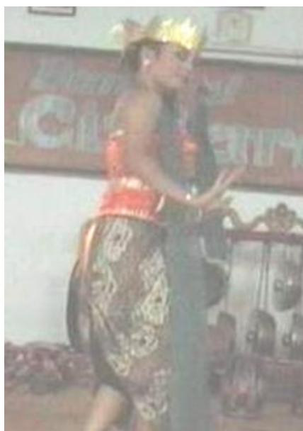
Foto 4.11 Ragam Gerak Lampah Luwes Ogek Lambung