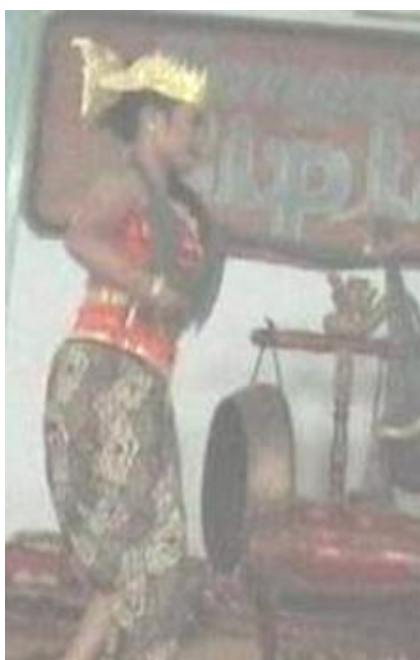
Foto 4.14 Ragam Gerak Pacak Gulu Sampir Sampur

sehingga memberi kesan yang santai pada gerak. Durasi yang terdapat pada gerak Pacak Gulu Sampir Sampur cukup lama yaitu 4x8 hitungan.