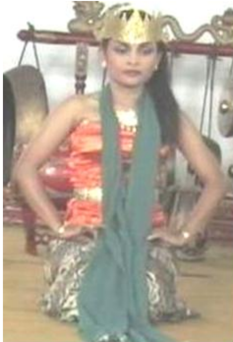
Gambar 5.5 Gambar Pementasan Tari Lobong Ilang