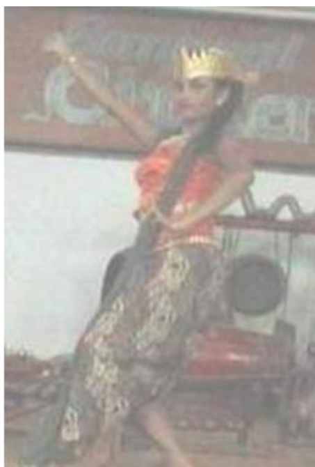
Foto 4.13 Ragam Gerak Geyol

Nilai keindahan gerak Geyol dilihat dari aspek waktu dapat dilihat dari ritme, tempo, dan durasi. Penggunaan ritme yang cepat pada gerak Geyol memberi kesan kuat dan tegas. Penggunaan tempo yang sedang memberi kesan cantik pada penari. Durasi yang digunakan pada gerak Geyol cukup lama yaitu 3x8 tambah 5-8 hitungan akan tetapi dengan aksen yang dihasilkan dari gerak pinggul membuat gerakan Geyol tidak monoton.