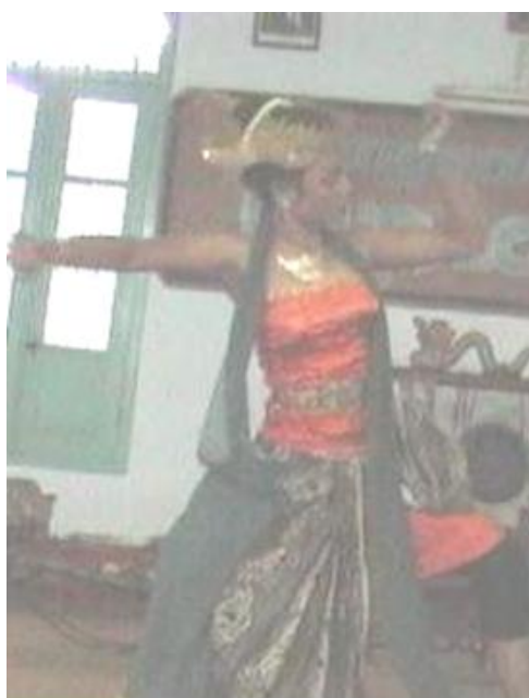
Foto 4.18 Ragam Gerak Bapangan

Nilai keindahan gerak Bapangan dilihat dari aspek waktu dapat dilihat dari aspek ritme, tempo, dan durasi. Ritme yang ada pada gerak Bapangan adalah cepat sehingga memberi kesan tegas pada gerak. tempo yang digunakan pada gerak Bapangan adalah cepat sehingga memberi kesan lincah pada gerak. durasi yang terdapat pada gerak Bapangan adalah 2x8 tambah 1-4 hitungan sehingga tidak memberi kesan membosankan pada penonton.