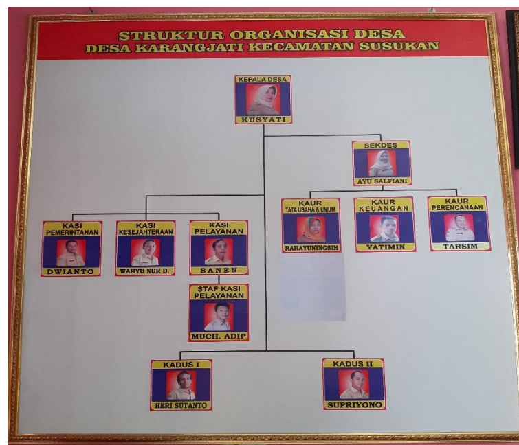
Gambar 5.4 Struktur Organisasi Kantor Kelurahan Desa Karangjati