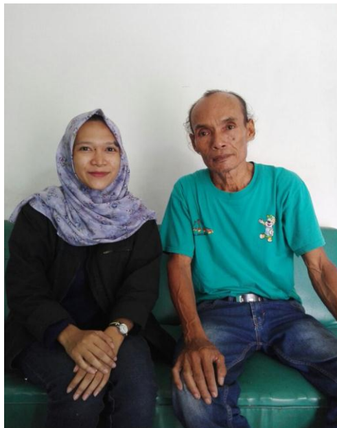
Gambar 5.2 Proses wawancara dengan narasumber