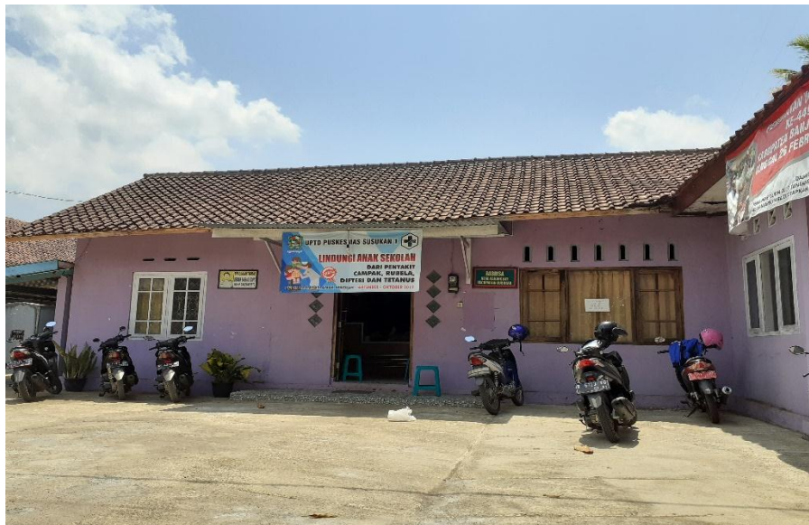
Gambar 5.3 Kantor Kelurahan Desa Karangjati