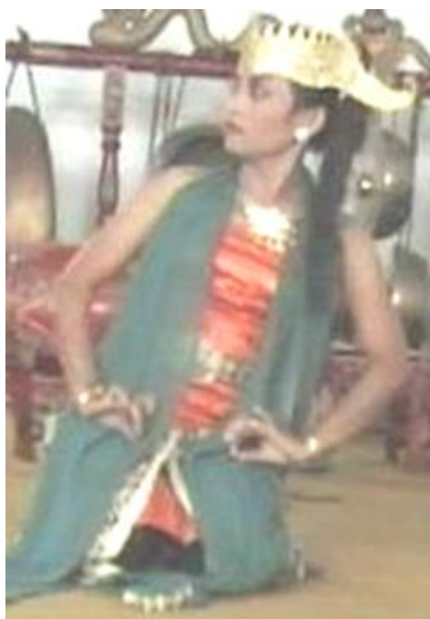
Foto 4.6 Ragam Gerak Ula Nglangi

Nglangi terlihat anggun dan lembut pada saat menari. Penggunaan ritme dan tempo yang pelan memberi kesan halus dan mengalir pada sajian gerak Ula Nglangi .