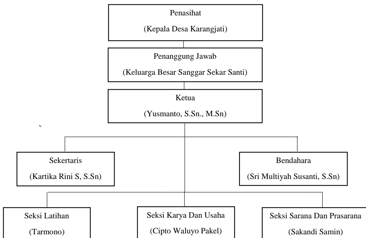
Bagan 4.1 Struktur Organisasi Sanggar Sekar Santi

Sanggar Sekar Santi memiliki susunan organisasi yang terdiri dari penanggung jawab, penasehat, ketua, sekretaris, bendahara, seksi latihan, seksi karya dan usaha, dan seksi sarana prasarana :