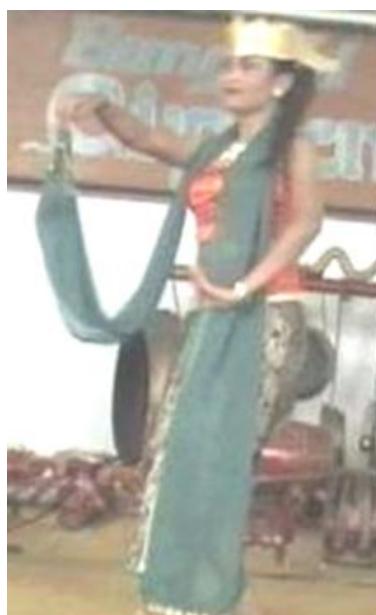
Foto 4.7 Ragam Gerak Hoyogan Kebyak Kebyok Sampur

kesan yang tegas, dengan penekanan pada gerak yang rendah dan penggunaan ritme yang pelan sehingga memberikan kesan halus dan mengalir pada tarian.