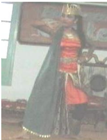
Foto 4.15 Ragam Pasang Wiron