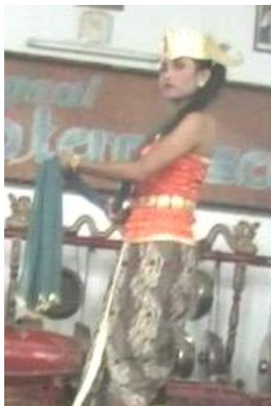
Foto 4.1 Ragam Gerak MlakuNgolong Sampur