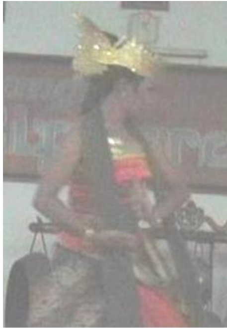
Foto 4.19 Ragam Gerak Tranjalan