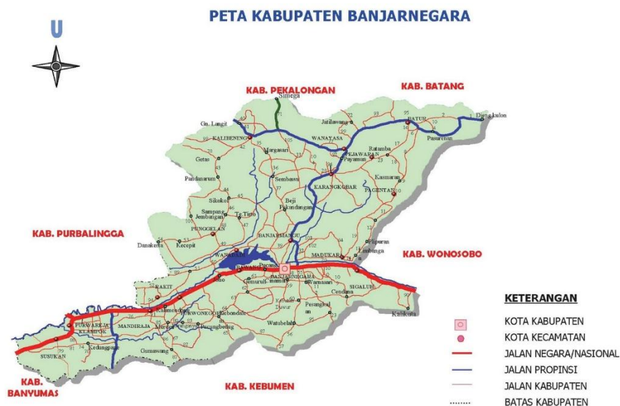
Gambar 4.1 Peta Kabupaten Banjarnegara

Lokasi penelitian yang sudah dilakukan oleh peneliti mengenai nilai estetika gerak Tari Lobong Ilang berada di sanggar Sekar Santi Desa Karangjati Kecamatan Susukan Kabupaten Banjarnegara. Berikut adalah peta Kabupaten Banjarnegara.