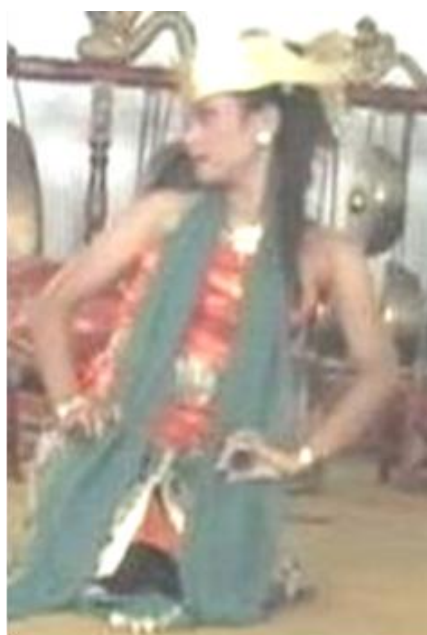
Foto 4.4 Ragam Gerak Gedheg

Nilai keindahan gerak Gedheg dilakukan oleh penari dengan gerakan yang lembut tetapi masih tetap terlihat tegas karena terdapat hentakan kepala 2 kali ke kanan dan kiri. Dengan menggunakan volume yang sempit dan posisi duduk simpuh serta menggunakan intensitas yang rendah membuat gerak Gedheg terlihat anggun dan lembut pada saat menari. Penggunaan ritme dan tempo yang pelan memberi kesan halus dan mengalir pada sajian gerak Gedheg .