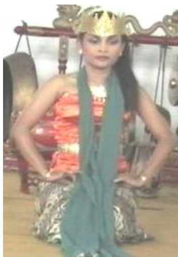
Foto 4.3 Ragam Gerak Simpuh Diam

Nilai keindahan gerak Simpuh Diam yang dilakukan oleh penari dengan gerakan yang lembut dan terlihat anggun tetapi memiliki fokus pandangan yang menggambarkan kemantapan hati dari seorang penari. Dengan menggunakan volume yang sempit, dengan posisi kaki duduk simpuh dan menggunakan intensitas gerak yang rendah membuat penari terlihat anggun dan menawan. Penggunaan tempo yang pelan pada saat gerak Simpuh Diam memberi kesan halus dan mengalir pada sajian gerak Simpuh Diam .