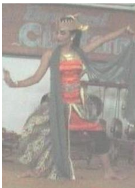
Foto 4.17 Ragam Gerak Laku Miring

Nilai keindahan gerak Laku Miring dilihat dari aspek waktu dapat dilihat dari ritme, tempo, dan durasi. Ritme yang ada pada gerak Laku Miring adalah cepat sehingga memberi kesan tegas pada gerak. Tempo yang digunakan pada gerak Laku Miring adalah cepat sehingga memberi kesan aktif atau lincah pada gerak. Durasi yang digunakan pada gerak Laku Miring adalah 2x8, 1-4 hitungan sehingga tidak memberi kesan bosan pada tari.