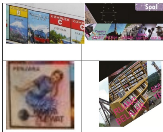
Gambar 2. Pengembangan Petak Chemi Chemi

Berdasarkan Gambar 2 menunjukkan bahwa pengembangan media Chemi Chemi terlihat pada papan monopoli biasa terdiri dari kompleks negara-negara, bandara dan stasiun. Di media Chemi Chemi , kompleks – kompleks itu terdiri dari tempat-tempat di Indonesia dan di dunia yang menghasilkan minyak bumi ( tempat pengeboran Minyak ). Modifikasi yang lain adalah pada monopoli terdapat petak penjara sedangkan pada Chemi Chemi terdapat ruang belajar. Jumlah petak pada monopoli adalah 40, sedangkan pada Chemi Chemi berjumlah 36. Selain melakukan modifikasi pada bagian petak-petaks, bagian lain yang dimodifikasi adalah kartu Chemi