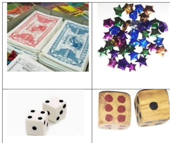
Gambar 4. Pengembangan kelengkapan Chemi Chemi

Berdasarkan gambar 3 menunjukkan bahwa pengembangan media Chemi Chemi terlihat pada Kartu Kesempatan diganti dengan kartu soal, kartu kesempatan diganti kartu materi dan kartu sewa diganti kartu kepemilikan. Pada kartu kepemilikan