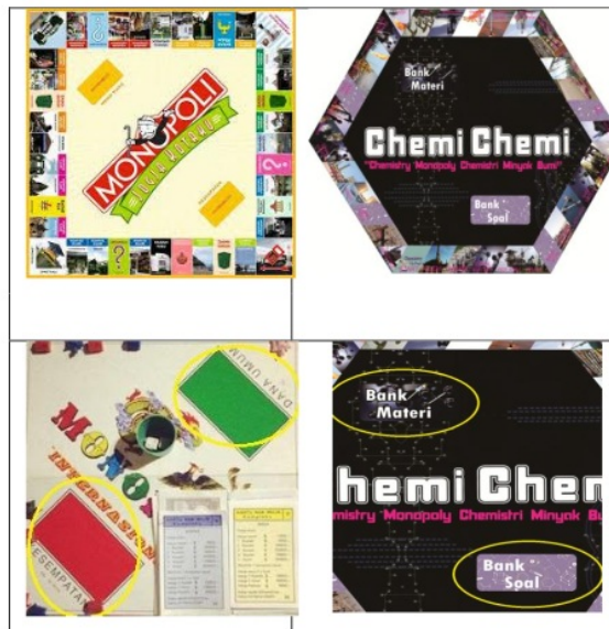
Gambar 1. Pengembangan Alas Chemi Chemi

Berdasarkan gambar 1 menunjukkan bahwa pengembangan media Chemi Chemi terlihat pada Papan monopoli biasa berbentuk persegi, sedangkan untuk papan Chemi Chemi ini berbentuk segi enam. Pada kotak dana umum diganti kotak bank materi dan kotak kesempatan diganti dengan petak bank soal. Selain melakukan modifikasi pada alas, bagian lain yang dimodifikasi adalah petak Chemi Chemi . Gambar pengembangan petak Chemi Chemi disajikan pada Gambar 2.