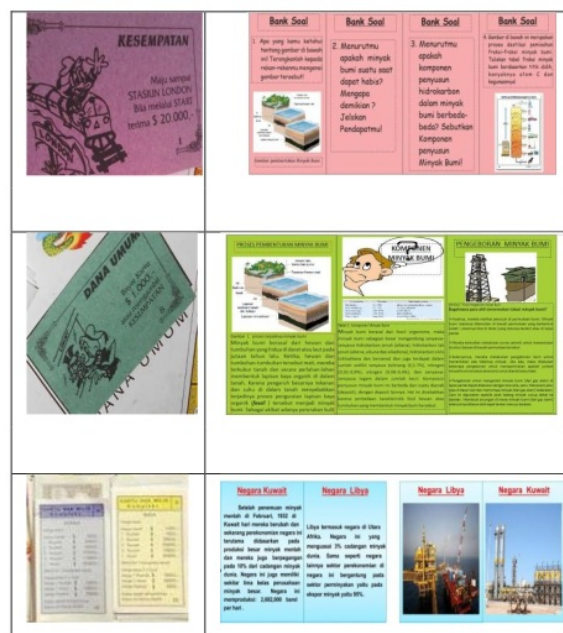
Gambar 3. Pengembangan Kartu Chemi Chemi

Chemi. Gambar pengembangan kartu Chemi Chemi disajikan pada Gambar 3.