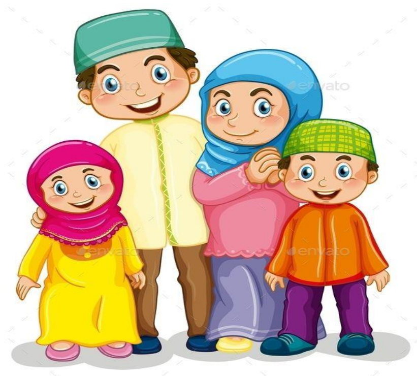
Gambar 17: Perencanaan Sehat

perbedaannya tetap masih memiliki persamaan, letak persamaannya adalah keinginan untuk dapat memenuhi kebutuhan keluarga yang telah direncanakan, dan kepuasan keluarga atas apa yang telah dicapainya, hal ini relative sifatnya. Salah satu gambaran perencanaan sehat keluarga, seperti pada gambar 17 berikut ini: