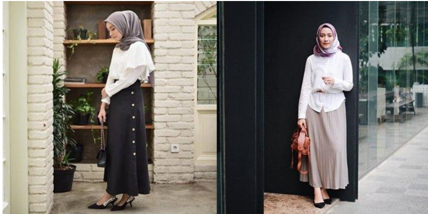
Gambar 6: Pakaian Kantor

Berikut ini adalah gambar 6, 7, 8 (Pakaian: Kantor, Rumah, Sekolah):