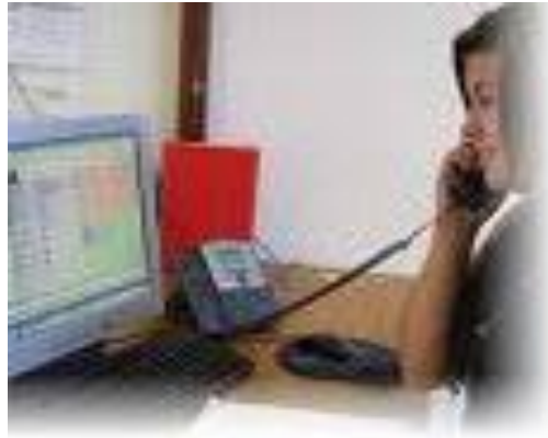
Gambar 9: Etiket menelepon

Berkaitan dengan etiket menelepon, dalam menangani baik telepon masuk maupun telepon keluar hendaknya memperhatikan hal-hal berikut: