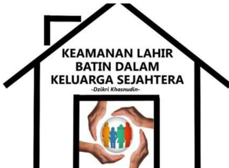
Gambar 16: Keamanan Lahir Batin

keterkaitan dengan hubungan antar keluarga, sebagai ilustrasi: orang tua akan merasa aman jika hubungannya dengan tetangga baik tanpa ada persoalan apapun; anak-anak juga akan merasa aman jika tidak memiliki persoalan dalam sosialisasi dengan teman di lingkungan baik yang dekat maupun jauh. Beberapa hal yang perlu diketahui orang tua berkaitan dengan keamanan lahir dan batin bagi keluarga antara lain: terpenuhinya kebutuhan spiritual, keharmonisan kehidupan keluarga, Keteraturan anggaran belanja keluarga, memahami kepribadian anggota keluarga. Gambar 16 berikut menggambarkan keamanan lahir dan batin bagi keluarga sejahtera: