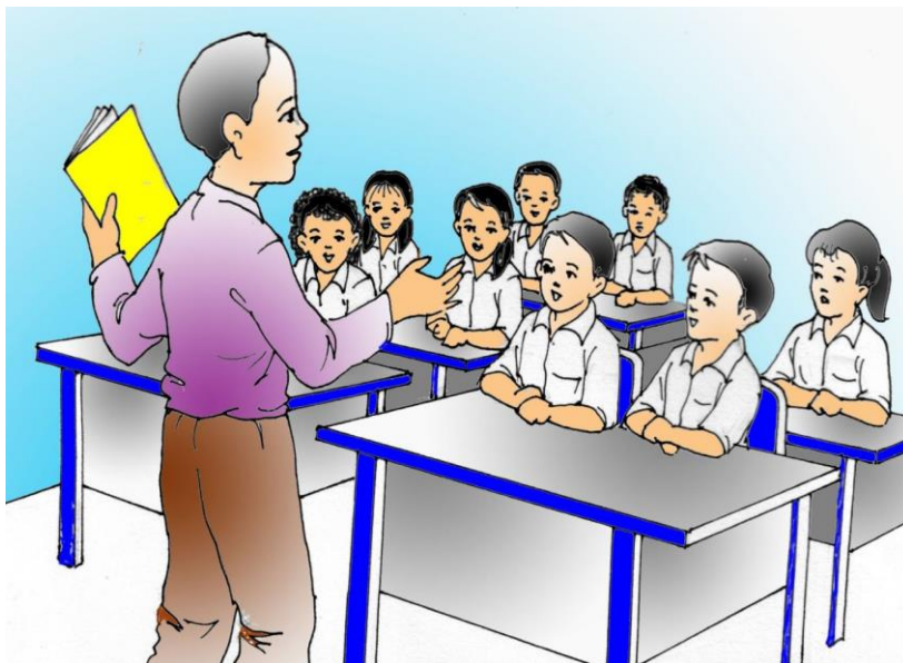
Gambar 13: sikap disiplin menerima pelajaran di kelas