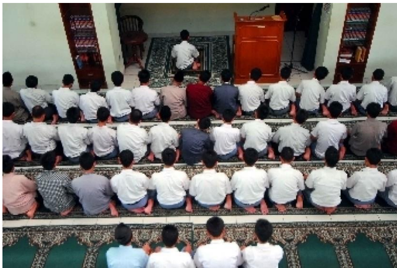
Gambar 15: Disiplin masyarakat dalam menjalankan ibadah