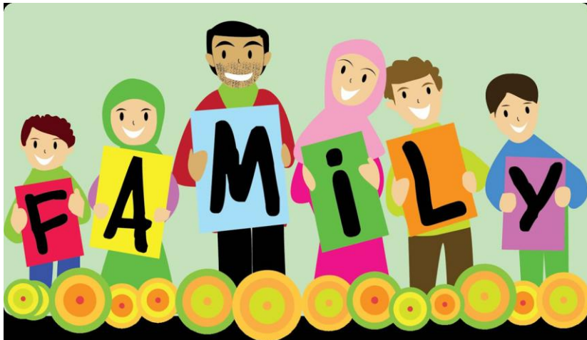
Gambar 1: Keluarga sehat dan bahagia

familier dengan sebutan keluarga bahagia, seperti gambar 1 berikut ini: