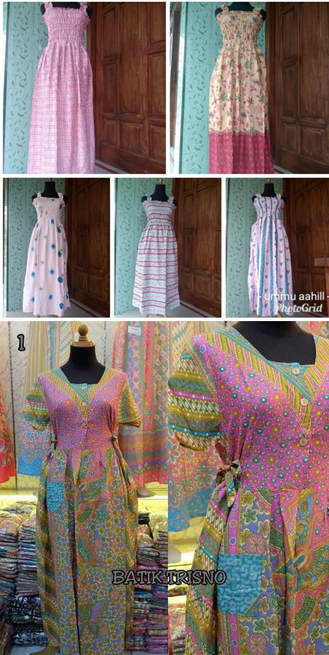
Gambar 7: Pakaian rumah