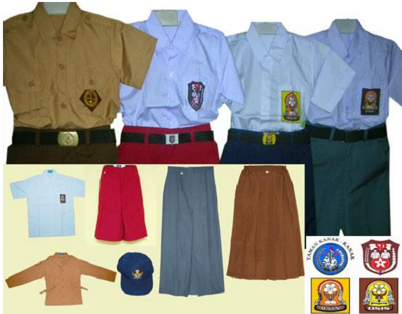
Gambar 8: Pakaian seragam sekolah