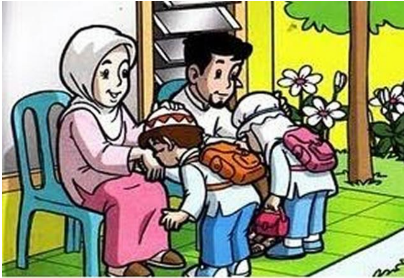
Gambar 2: Anak- anak sedang mencium tangan kedua orang tua saat mau berangkat ke sekolah

Namun demikian ada beberapa perbedaan sangat penting antara etika dan etiket, seperti disajikan berikut ini: