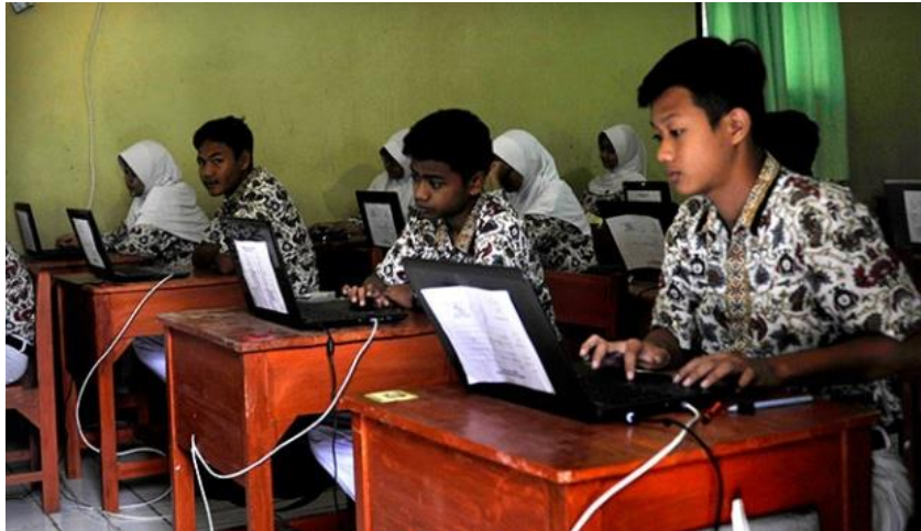
Gambar 11: Sikap jujur anak sekolah

Peran Guru sangat dibutuhkan dalam membangun kebiasaan kejujuran akademik, berkaitan dengan hal tersebut, ada beberapa aspek yang perlu diperhatikan, yakni: pertama; membangun kejujuran harus dimulai dari dirinya sendiri sebagai seorang guru, misalnya: antara perkataan, perbuatan dan tindakan harus sesuai dengan norma-norama yang berlaku. Kedua; sebagai seorang guru, yang tugas utamanya adalah mendidik, melatih, mengarahkan, menilai dan mengevaluasi kepada peserta didiknya, maka guru mempunyai kewajiban untuk membentuk karakter anak didiknya memiliki sikap disiplin, jujur, mandiri, demokratis dan bertanggungjawab. Ketiga; guru secara akademik juga mempunyai tanggungjawab untuk membesarkan