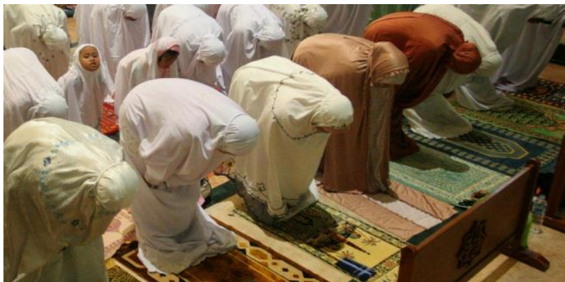
Gambar 4: Ibu- ibu Sholat berjamaah di Masjid

Dari deskripsi perbedaan etika dan etiket tersebut, jelaslah bahwa etika adalah yang utama dan mendasar untuk membentuk sikap dan perilaku, untuk selanjutnya apabila didukung oleh pengalaman etiket yang baik, maka sikap dan perilaku tersebut akan sempurna. Berikut ini gambaran etika, secara konsep mendasar sehingga dilakukan dimanapun sama, gambar 4 dan 5 merupakan perilaku ilustrasi etika, yakni seorang ibu sedang solat di Masjid dan sholat di rumah, maka hukumnya tetap sama- sama wajib mengenakan mukena/ rukuh: