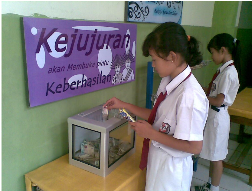
Gambar 10: Kejujuran anak di sekolah

meningkatkan kemampuan dirinya, selanjutnya diharapkan siap menjadi generasi penerus bangsa yang handal. Berikut ini gambar 10, 11 membiasakan pribadi yang jujur bagi anak sekolah: