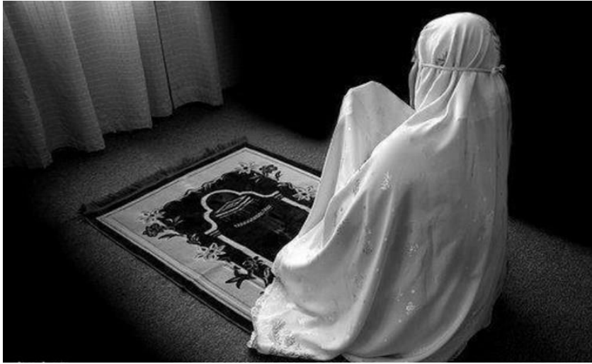
Gambar 5: Seorang ibu Sholat di rumah

Jika telah mempunyai etika dengan perilaku yang benar hendaklah didukung oleh etiket yang baik pula, maka kita akan berhasil karena secara lahiriah kita disenangi, dihormati atau dihargai oleh orang lain. Sebaliknya, apabila kita hanya mengamalkan etiket yang baik tanpa didukung dengan etika, maka hanya dalam jangka waktu yang pendek kita akan tampak berhasil, karena kita telah sukses memanipulasi nurani, batin kita dengan penampilan lahiriah yang meyakinkan, sehingga kita dihargai, dihormati, dan disenangi, namun tidak ada kebenaran di dalam kebaikan. Agar kita dapat dihargai dan disenangi orang lain sepanjang masa, maka kita harus dapat mengamalkan secara bersama-sama antara