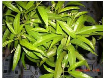
Gambar 1. Tanaman Zodia

Insektisida nabati atau insektisida botani (bioinsektisida) adalah bahan alami yang berasal dari tumbuhan yang mempunyai kelompok metabolit sekunder yang mengandung beribu-ribu