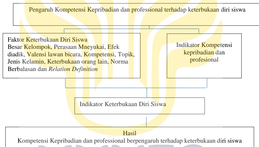
Gambar 2.2 Kerangka Berpikir

terhadap sesuatu akan cenderung buruk. Semakin baik persepsi siswa tentang kompetensi Guru BK, semakin baik pula (meningkat) keterbukaan diri siswa terhadap Guru BK. Dan sebaliknya, semakin buruk persepsi siswa tentang kompetensi Guru BK, semakin buruk pula (menurun) keterbukaan diri siswa terhadap Guru BK. Untuk lebih memperjelas hubungan kedua variabel maka peneliti menggambarkan hubungan kedua variabel dengan menggunakan bagan sebagai berikut :