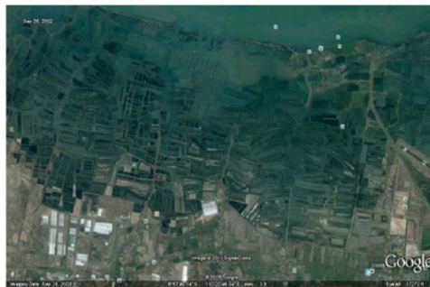
Gambar 1. Peta lokasi penelitian, Ekosistem mangrove Wilayah Tapak, Kelurahan Tugurejo Kota Semarang

Penelitian ini dilakukan di wilayah Tapak, Kelurahan Tugurejo Kota Semarang. Sampel penelitian untuk pengukuran logam berat pada ekosistem mangrove diambil menggunakan teknik “ purposive sampling ” berdasarkan sebaran tambak dari daratan ke arah laut.