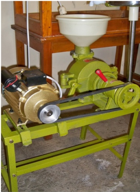
Gambar 3. Mesin penggiling kedelai dengan penggerak motor listrik

yang suaranya halus sehingga walaupun dinyalakan pagi hari tidak akan mengganggu warga sekitar.