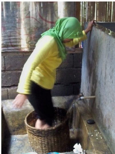
Gambar 2. Pemecahan kedelai: masih tradisional

Selain aspek teknis mesin/peralatan, aspek manajemen produksi juga belum mendapat perhatian para perajin. Hal ini dapat dilihat dari tata letak ( layout ) peralatan produksi, kebersihan dan kesehatan lingkungan maupun pekerja yang terkesan kumuh. Posisi kerja terhadap peralatan ( ergonomi ), penempatan peralatan, bahan baku, gudang penyimpanan selama ini baik di mitra I maupun II masih belum tertata dengan baik sehingga hal ini juga mempengaruhi produktivitas kerja.