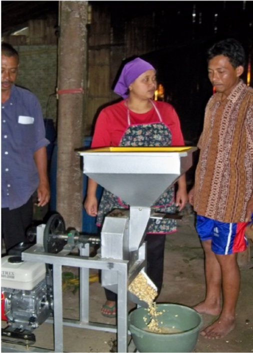
Gambar 4. Uji coba mesin pemecah kedelai

tempat kerja lebih bersih, dan perlengkapan K3 (keselamatan dan kesehatan kerja) bagi pekerja yang lebih baik.