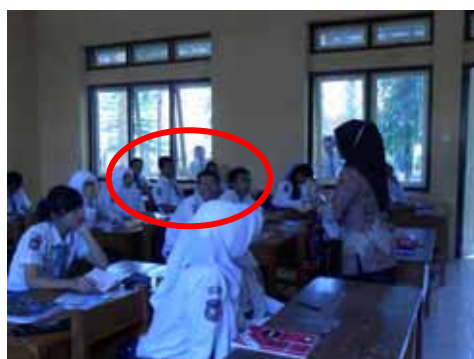
Gambar 5. Menghargai Perbedaan Pendapat.

Perubahan perilaku siswa yang berkaitan dengan perilaku menghargai perbedaan pendapat terlihat dari siswa yang mau menerima dengan berlapang dada jika pendapatnya kurang tepat dan kurang diterima oleh anggota kelompok/teman yang lain, tidak ada yang mengolok-olok kekurangan yang dimiliki teman, jujur dan terbuka dalam menyampaikan pendapat. Nilai yang telah diperoleh siswa yang memiliki perilaku tersebut sebesar 81,25.