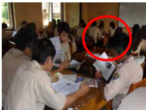
Gambar 8. Perilaku Siswa Aspek Kedisiplinan

Perubahan perilaku berkaitan dengan keaktifan dapat dilihat dari keantusiasan siswa dan kerja sama siswa dalam berdiskusi menjawab permasalahan yang diberikan oleh guru untuk merumuskan pengetahuan siswa. Senilai 84,03 dari siswa yang terlihat aktif dan bertanggung jawab dalam kelompoknya. Hal ini terlihat dengan siswa yang terlibat perdebatan untuk menemukan jawaban pertanyaan yang diajukan.