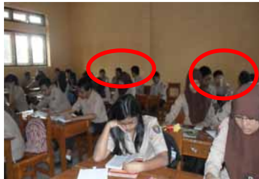
Gambar 2. Perilaku Siswa Aspek Kedisiplinan

Perubahan perilaku yang berkaitan dengan kedisiplinan ditandai dengan mengumpulkan tugas tepat waktu. Hal ini ditunjukkan dengan beberapa siswa secara bersungguh-sungguh menyelesaikan tugas sesuai dengan waktu yang telah ditentukan, kemudian mengumpulkan sesuai waktu yang ditentukan. Akan tetapi, masih terdapat beberapa siswa yang kurang berdisiplin dalam mengerjakan dan mengumpulkan tugas. Perhatikan gambar berikut.