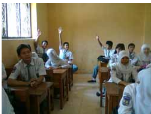
Gambar 11. Perilaku Siswa Aspek Menghargai Pendapat

Perubahan perilaku siswa yang berkaitan dengan perilaku menghargai perbedaan pendapat terlihat dari siswa yang mau menerima dengan berlapang dada jika pendapatnya kurang tepat dan kurang diterima oleh anggota kelompok/teman yang lain, tidak ada yang mengolok-olok kekurangan yang dimiliki teman, jujur dan terbuka dalam menyampaikan pendapat pada saat diskusi berlangsung. Sebesar nilai 90,97 telah diperoleh siswa yang memiliki perilaku tersebut.