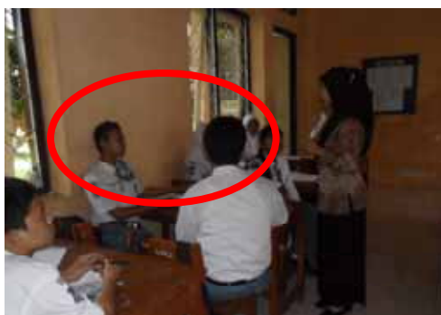
Gambar 3. Perilaku Siswa Aspek Keaktifan

tersebut juga mempunyai keinginan agar dapat belajar menulis resensi dengan baik. Siswa yang pasif di kelas biasanya siswa tersebut sudah tidak menemukan kesulitan atau sudah paham dengan penjelasan guru, siswa yang kurang menikmati pembelajaran tersebut sehingga siswa tidak cukup berani untuk bertanya, takut, dan siswa yang cuek terhadap pembelajaran. Perhatikan gambar di bawah ini.