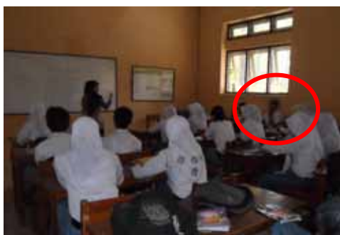
Gambar 6. Perilaku Siswa Aspek Kejujuran

Perubahan perilaku siswa yang berkaitan dengan aspek kejujuran ditandai dengan hasil pekerjaan siswa yang benar-benar hasil tulisan sendiri. Artinya tidak menyontek pekerjaan teman, merupakan hasil pemikiran siswa sendiri. Dalam siklus I, hanya mencapai nilai 81,94 untuk siswa yang memiliki perilaku demikian. Perilaku siswa nampak pada gambar berikut.