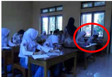
Gambar 4. Perilaku Siswa Aspek Kesungguhan

untuk melakukan hal tersebut, mereka hanya pasif dalam menerima informasi yang disampaikan oleh guru dan tidak berusaha mencari referensi lain untuk menambah pengetahuan mereka tentang menulis resensi.