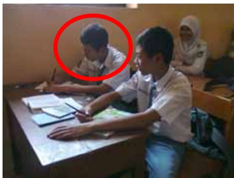
Gambar 10. Perilaku Siswa Aspek Kesungguhan

mengerjakan resensi, pasti disiplin/tepat waktu dalam menyelesaikan dan mengumpulkan tugas. Selain itu, selalu mencatat keterangan-keterangan penting yang disampaikan oleh guru tentang menulis resensi. Siswa yang menunjukkan perilaku tersebut mencapai 82,64 yang berkategori baik.