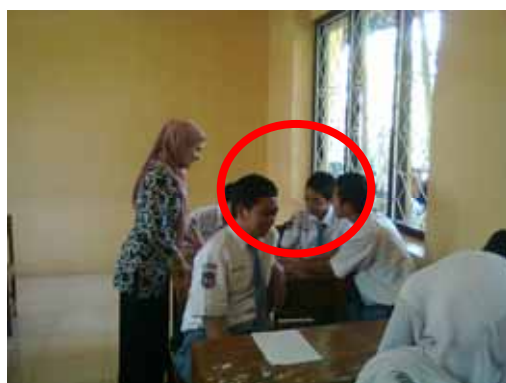
Gambar 9. Perilaku Siswa Aspek Keaktifan

Perubahan perilaku berkaitan dengan keaktifan dapat dilihat dari keantusiasan siswa dan kerja sama siswa dalam berdiskusi menjawab permasalahan yang diberikan oleh guru untuk merumuskan pengetahuan siswa. Senilai 84,03 dari siswa yang terlihat aktif dan bertanggung jawab dalam kelompoknya. Hal ini terlihat dengan siswa yang terlibat perdebatan untuk menemukan jawaban pertanyaan yang diajukan.