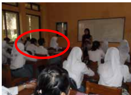
Gambar 1. Perilaku Siswa Aspek Rasa Hormat

Perubahan perilaku siswa dalam menaruh rasa hormat dapat dilihat pada saat siswa memberi kesempatan kepada guru untuk berbicara, sebagian besar siswa mendengarkan apa yang disampaikan oleh guru, tetapi beberapa siswa masih menganggap remeh pembelajaran menulis resensi. Hal tersebut dibuktikan dengan perilaku berbicara sendiri/mengobrol dan menjawab semauanya sendiri apa yang ditanyakan oleh guru. Perilaku menghormati guru telah diperoleh siswa dengan nilai rata-rata 75, seperti pada gambar berikut ini.