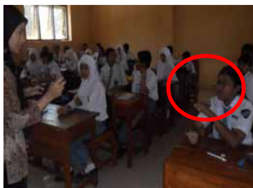
Gambar 12. Perilaku Siswa Aspek Kejujuran

Perubahan perilaku siswa yang berkaitan dengan kejujuran ditunjukkan dengan hasil pekerjaan siswa yang tidak menunjukkan kesamaan dengan teman dalam satu kelompok, mereka telah mengerjakan tugas menulis resensi sesuai dengan pemikiran siswa sendiri. Dalam siklus II, sebanyak 88,89 nilai yang diperoleh siswa yang memiliki perilaku demikian.