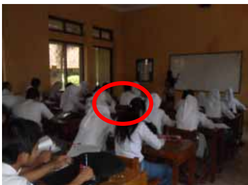
Gambar 7. Perilaku Siswa Aspek Rasa Hormat

Perubahan perilaku siswa menghormati guru dapat dilihat pada saat siswa memberi kesempatan kepada guru untuk berbicara, siswa mendengarkan apa yang disampaikan oleh guru dengan cermat, sehingga nilai yang diperoleh pada siklus II meningkat menjadi lebih baik serta tidak menunjukkan perilaku negatif seperti mengobrol dengan teman, membuat gaduh, mengganggu teman lain yang sedang serius belajar, dan sebagainya.